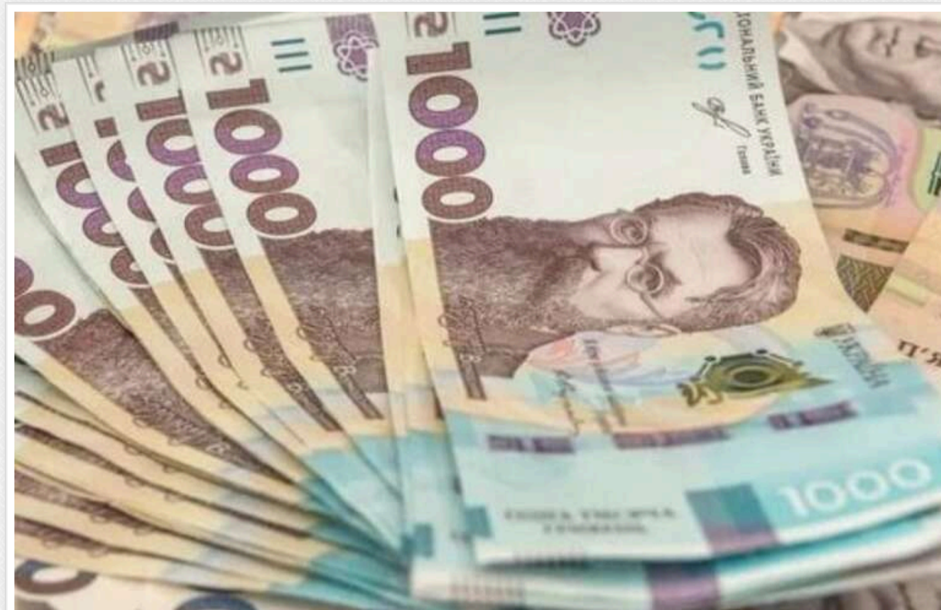
«Зимова єПідтримка»: понад 2,3 мільйона українців вже отримали виплати

З учора цього дня вже понад 2,3 млн українців отримали виплати за програмою «Зимова єПідтримка», з них 520 тис. – діти.