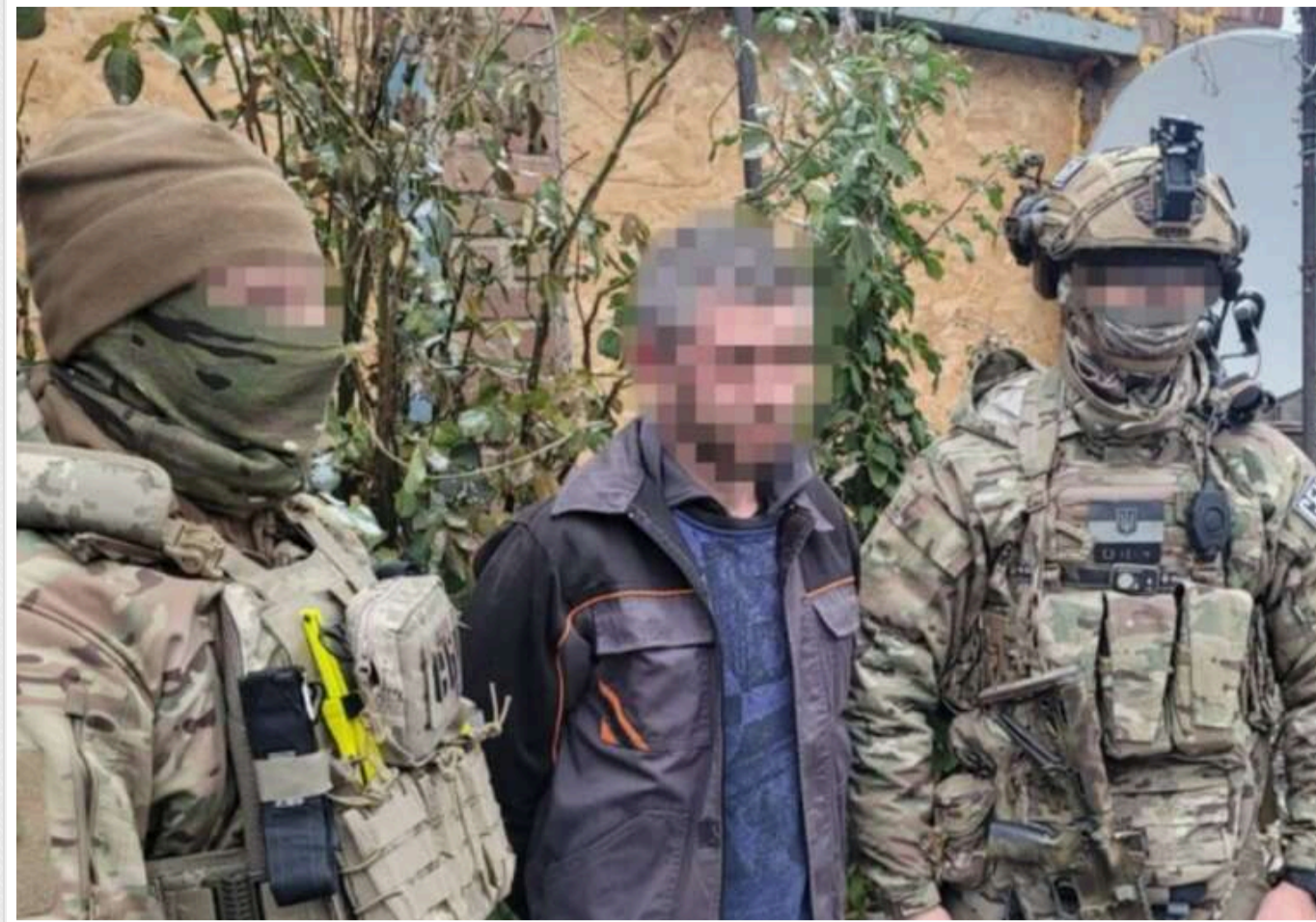
Служба безпеки України затримала агента російської розвідки

Служба безпеки України виявила й затримала 39-річного жителя Донецької області, який шпигував на користь російської військової розвідки (ГРУ).