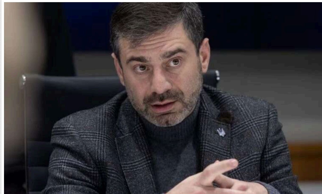
Лубінець: Протягом 2024 року росіяни розстріляли 109 українських військовополонених

Уповноважений Верховної Ради з прав людини Дмитро Лубінець повідомив, що протягом 2024 року вдалося офіційно підтвердити розстріли 109 українських військовополонених росіянами.