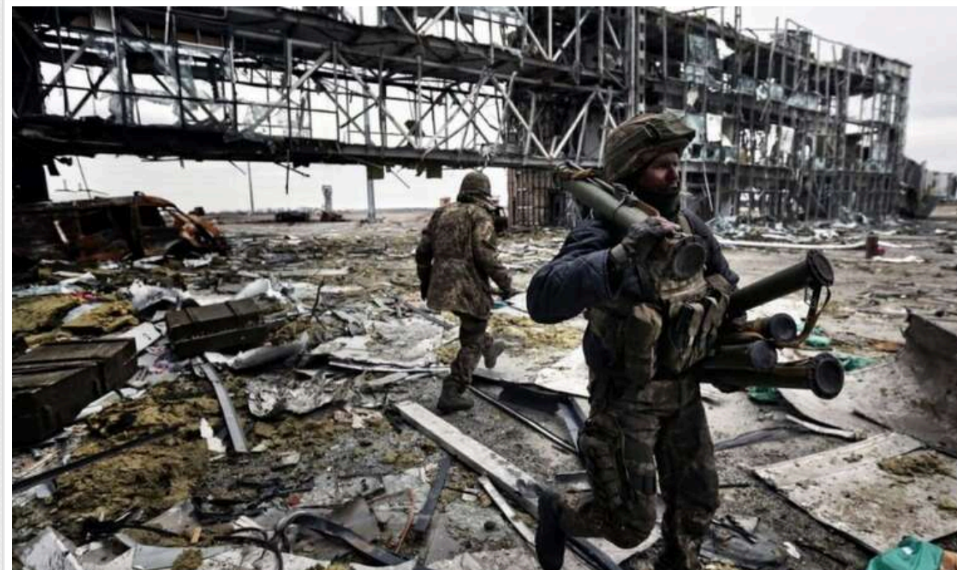
Пушилін пообіцяв відновити в Донецьку зруйнований окупантами аеропорт

Лідер "ДНР" Денис Пушилін пообіцяв відновити в Донецьку аеропорт, зруйнований російськими окупантами, і відновити залізничне сполучення.