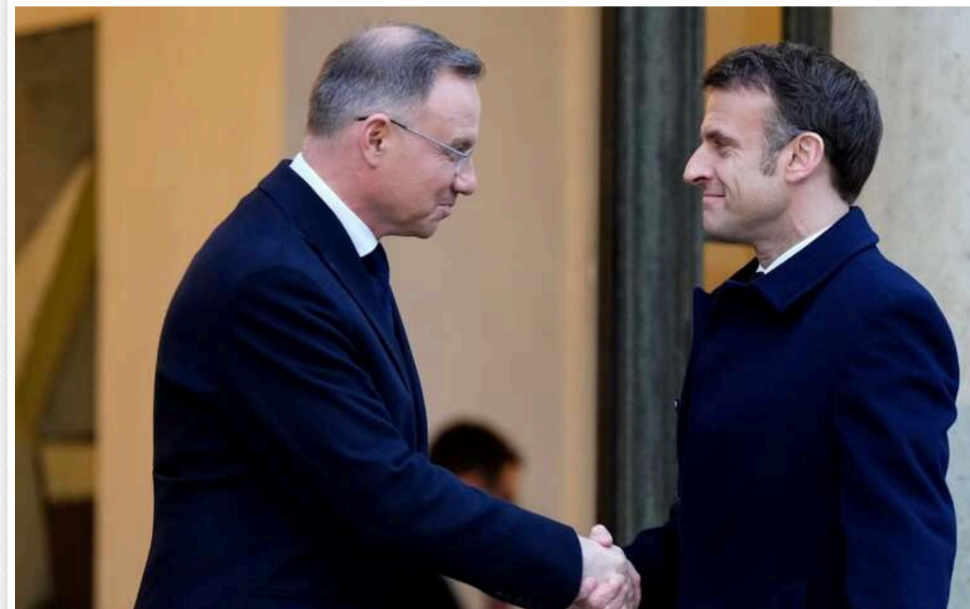
Макрон хоче обговорити спільну миротворчу місію в Україні під час візиту до Варшави

Макрон приїде до Польщі, щоб обговорити спільну миротворчу місію в Україні.