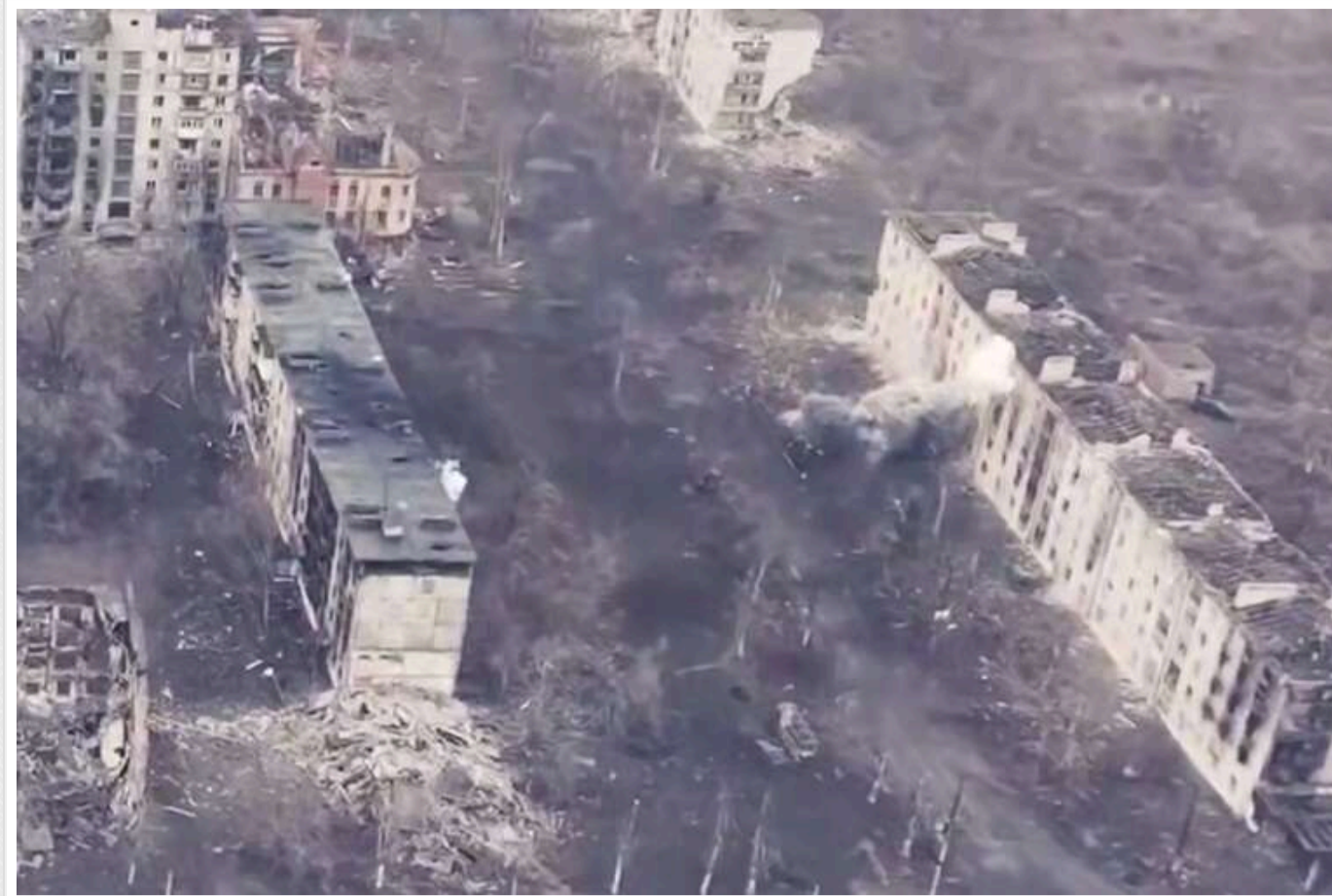
У Торезьку тривають бої: у мережі показали, який вигляд має місто