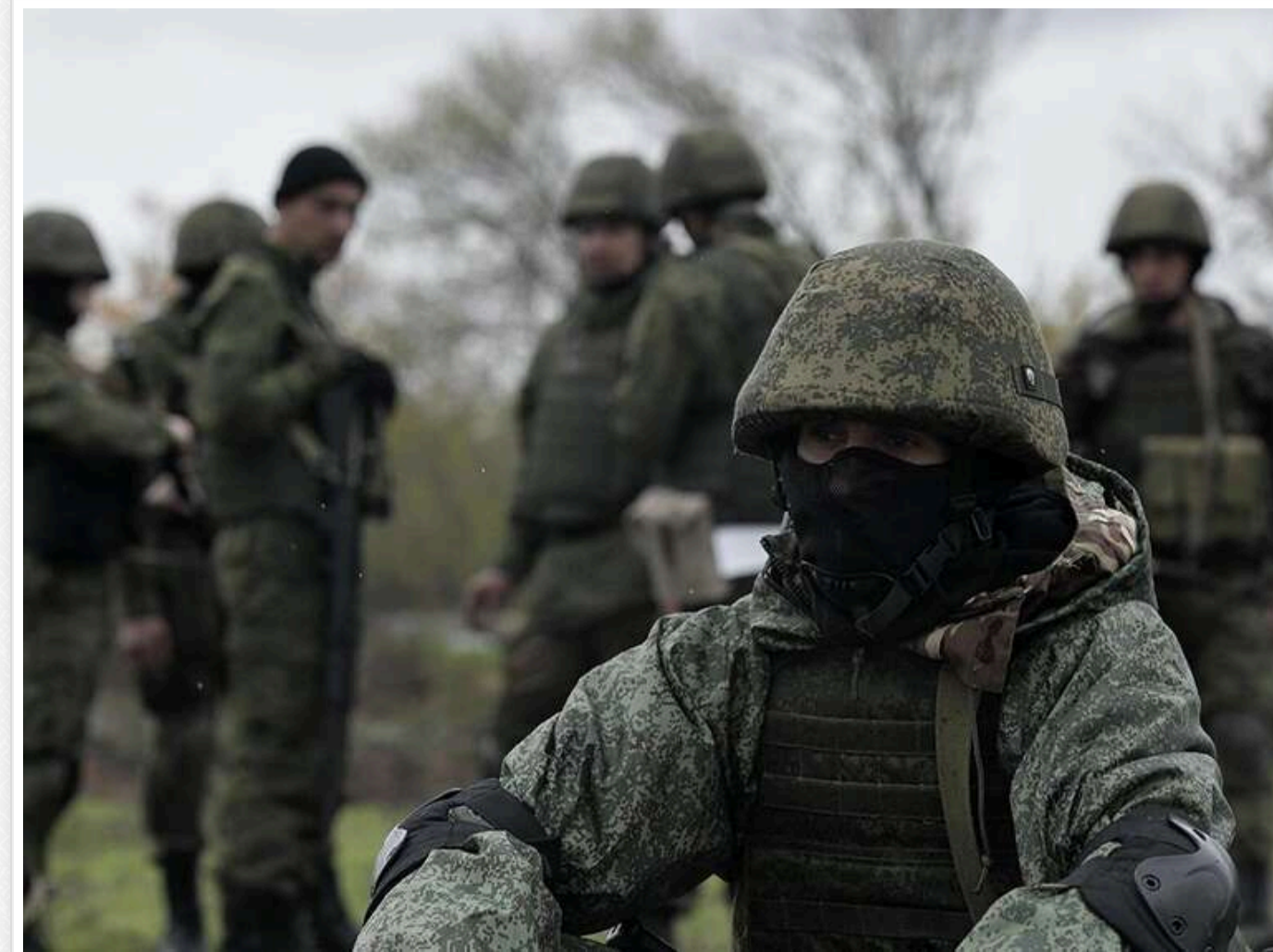
Російським загарбникам до Покровська залишилося 2-2,5 кілометра, - український військовий

До фронтової лінії від Покровська залишилося 2-2,5 км, повідомив український військовий з позивним «Алекс».