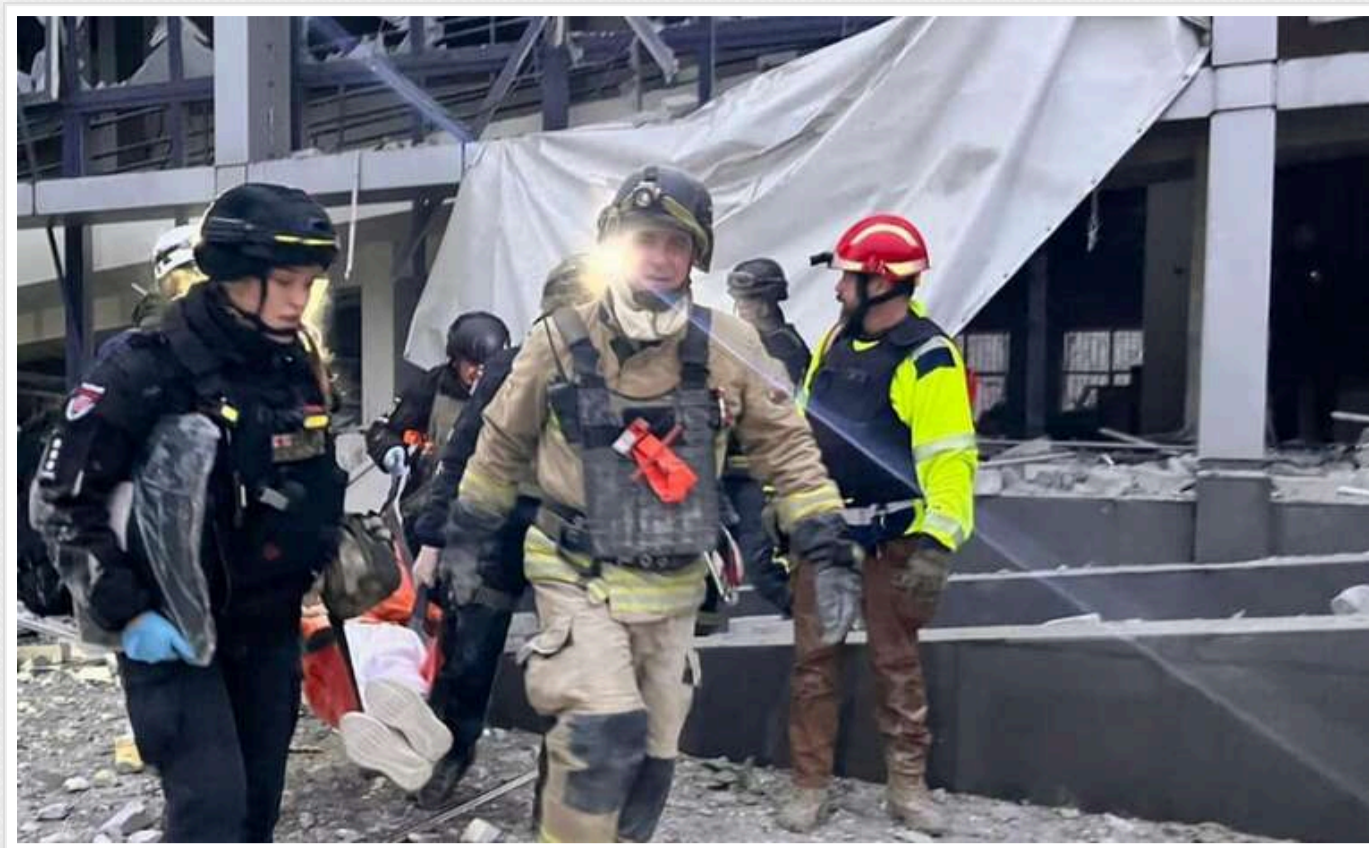
У Запоріжжі з-під завалів дістали ще одного загиблого

У місті Запоріжжя, де російські війська атакували центр міста, під руїнами знайшли тіло ще одного загиблого. Щонайменше 6 осіб залишаються під завалами.