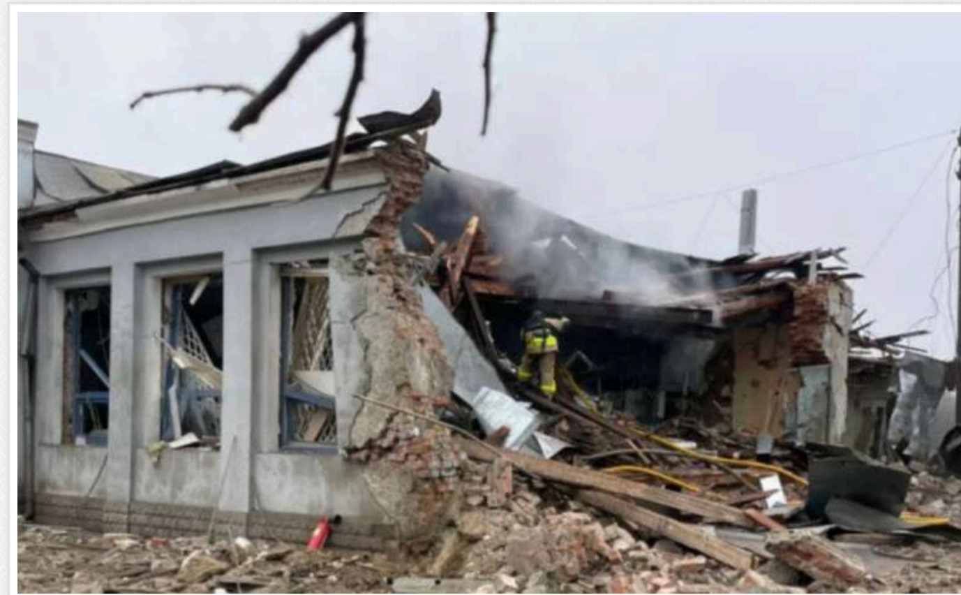
Окупанти під час атаки на Златопіль використали стратегію подвійного удару - ОВА

У Златополі в Харківській області росіяни влучили двічі балістичними ракетами, серйозно постраждала цивільна інфраструктура.