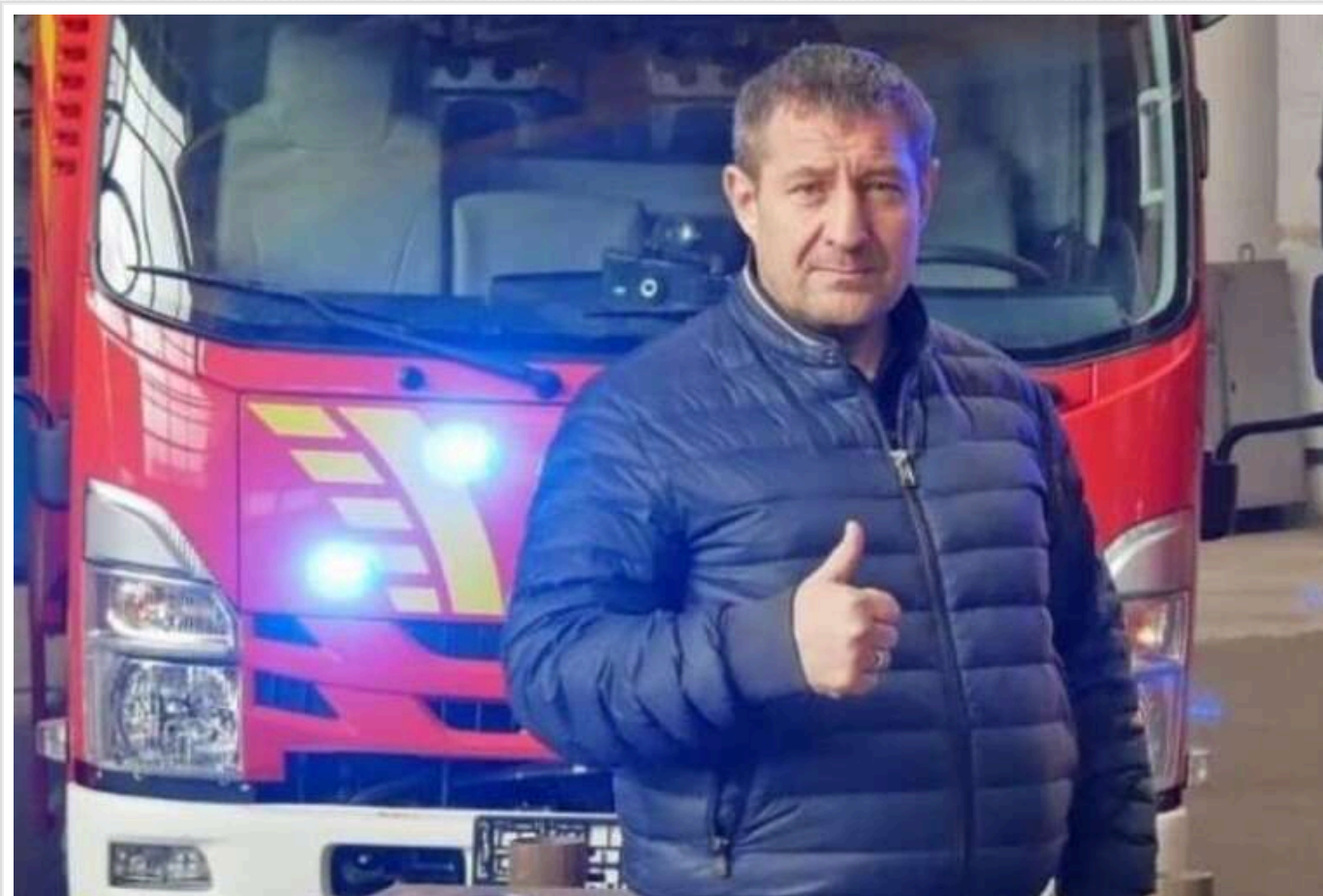
Фірма Олега Авер'янова, який зараз переховується за кордоном від тюремного терміну, виграла черговий тендер на пів мільярда: хто за цим стоїть?

Перший тиждень останнього місяця року приніс чергову зраду – фірма Олега Авер'янова, який наразі перебуває на втіках від тюремного строку у сім років, виграла тендер на пів мільярда гривень.