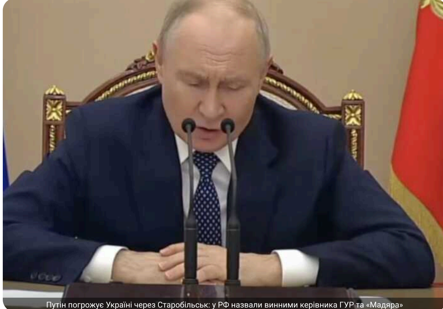
Путін погрожує Україні через Старобільськ: у РФ назвали винними керівника ГУР та «Мадяра»

Президент РФ Володимир Путін заявив, що українська влада нібито «відкрила нову сторінку» у війні після удару по коледжу в Старобільську, внаслідок якого, за даними російської сторони, загинула 21 людина.