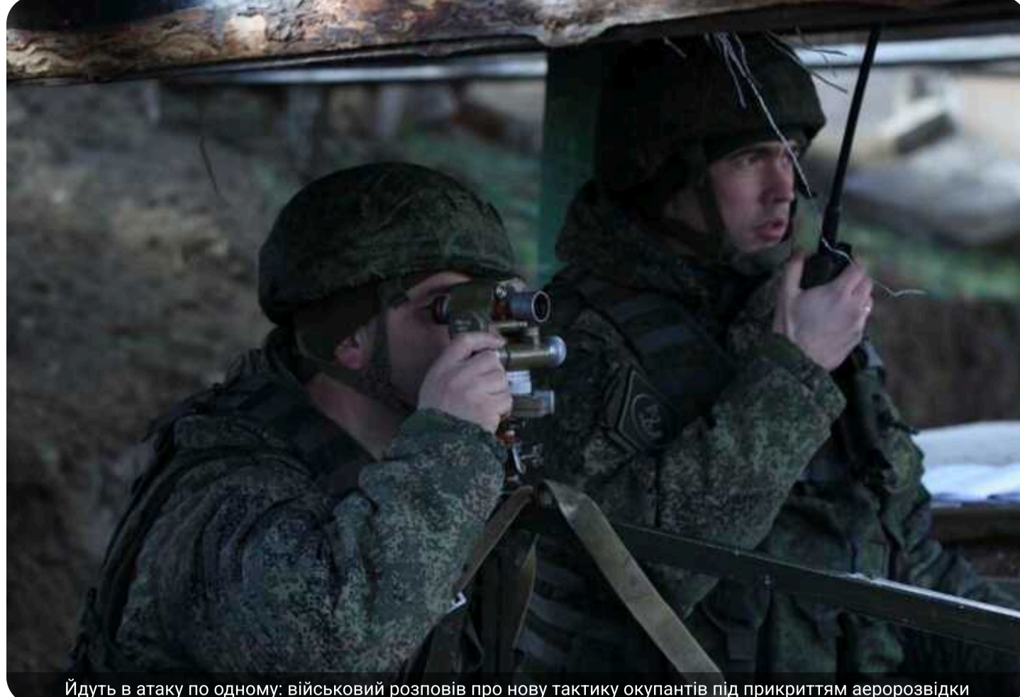
Йдуть в атаку по одному: військовий розповідь про нову тактику окупантів під прикриттям аеророзвідки

Російські війська від початку весни активізували наступальні дії на Олександрівському напрямку. Окупанти накопичують сили на зайнятих рубежах і намагаються проникати глиб української оборони малими піхотними групами.