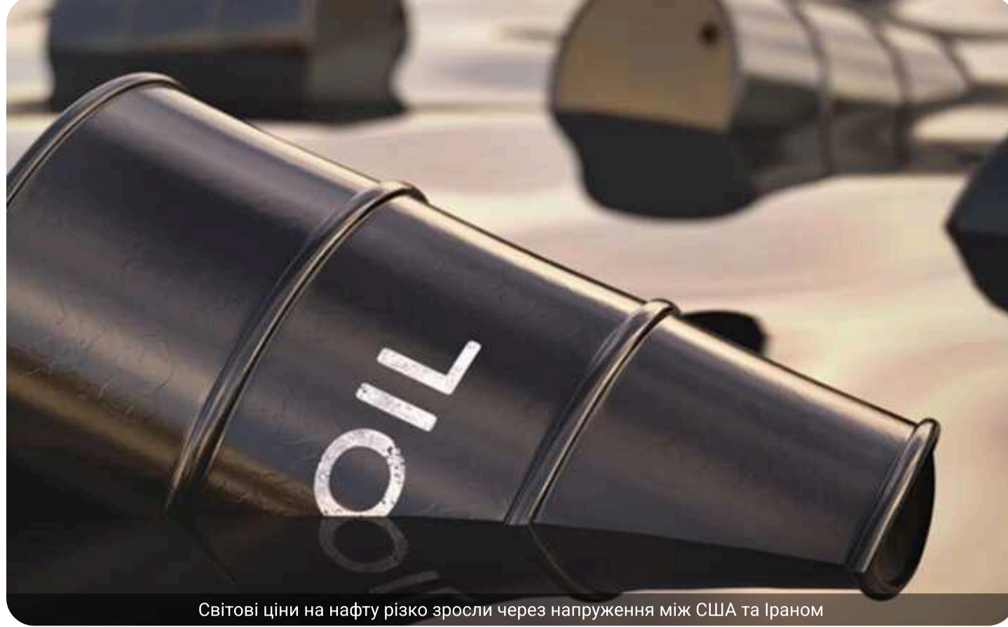
Світові ціни на нафту різко зросли через напруження між США та Іраном

Світові ціни на нафту стрімко зросли після повідомлень про призупинення контактів між Іраном і США, а також через загрозу перекриття ключових морських маршрутів у регіоні.