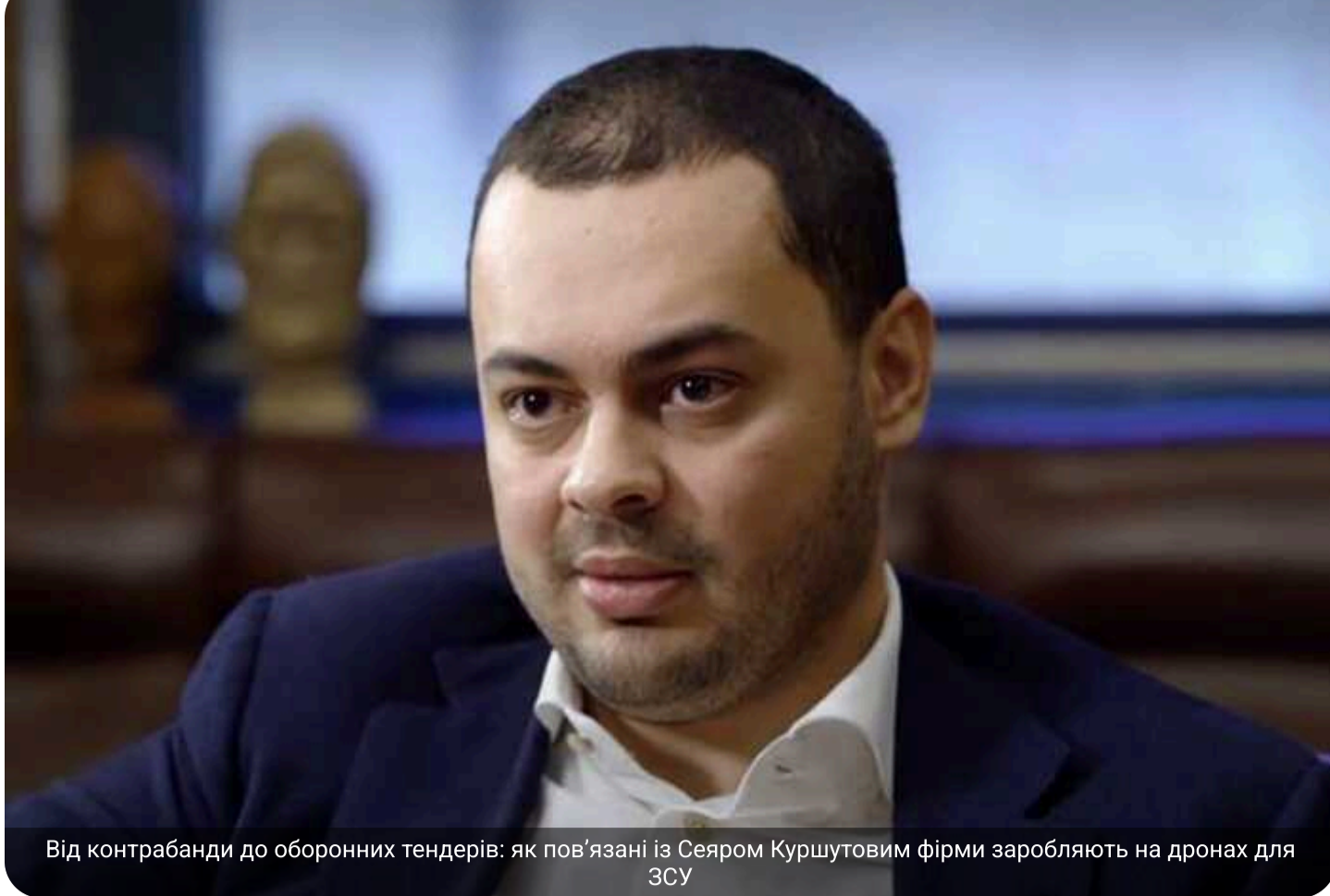
Від контрабанди до оборонних тендерів: як пов'язані із Сеяром Курштовим фірми заробляють на дронах для ЗСУ

Фігурант санкцій РНБО Сеяр Курштов, позбавлений українського громадянства, може бути пов'язаний із компаніями, які отримують замовлення на БПЛА для армії.