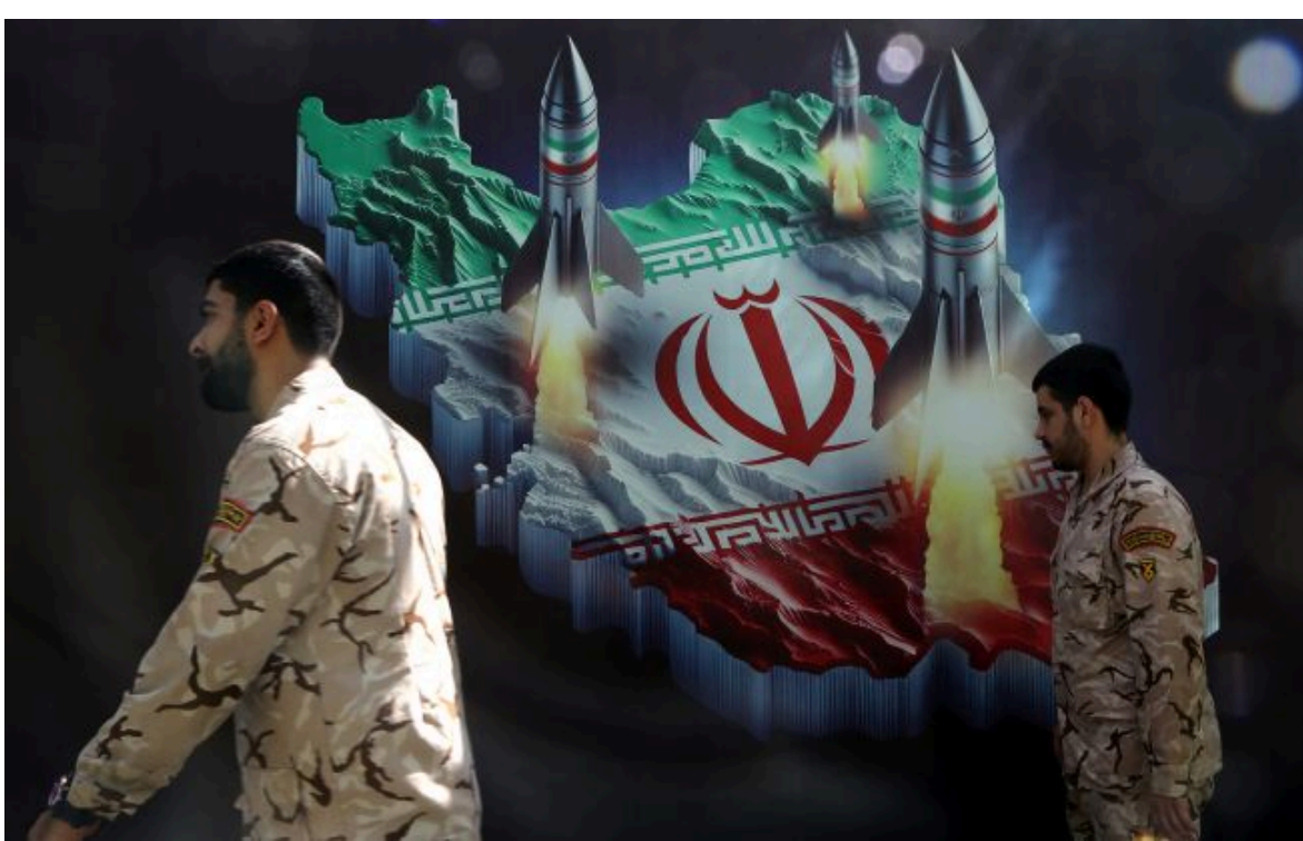
Фото: іранські військові на тлі зображення ракет та карти Ірану