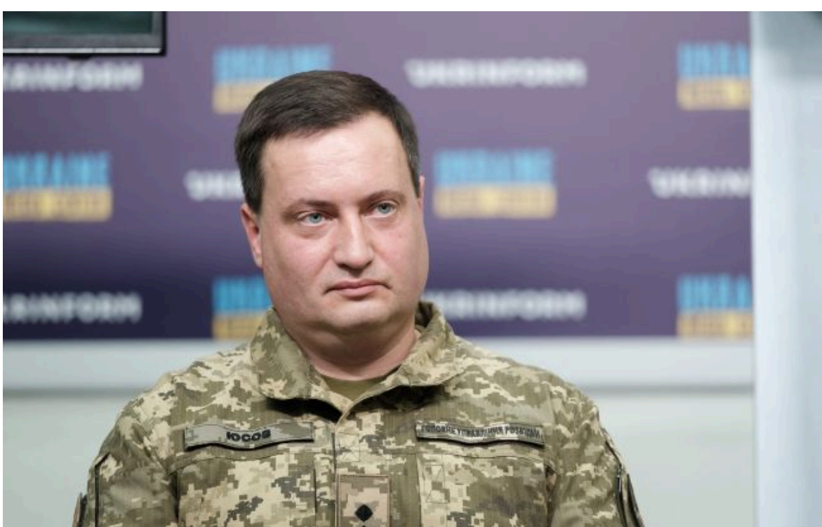
Фото: Андрій Юсов, представник ГУР (Віталій Носач, РБК-Україна)

Розумій ситуацію на фронті через факти, а не чутки з РБК-Україна у Google