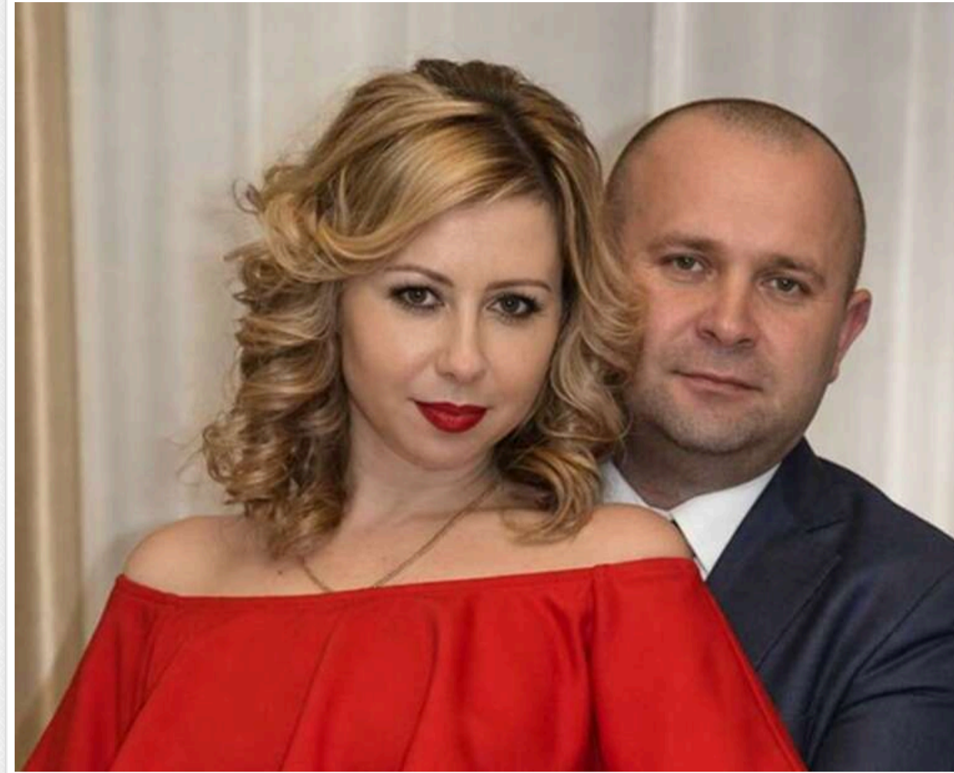
Стрімке зростання обігу під час перевірок: як розвивається спиртовий бізнес Віталія Марчука на тлі справ АМКУ

Поки АМКУ розбирається з аукціонами: звідки ростуть обігу імперії Віталія Марчука?