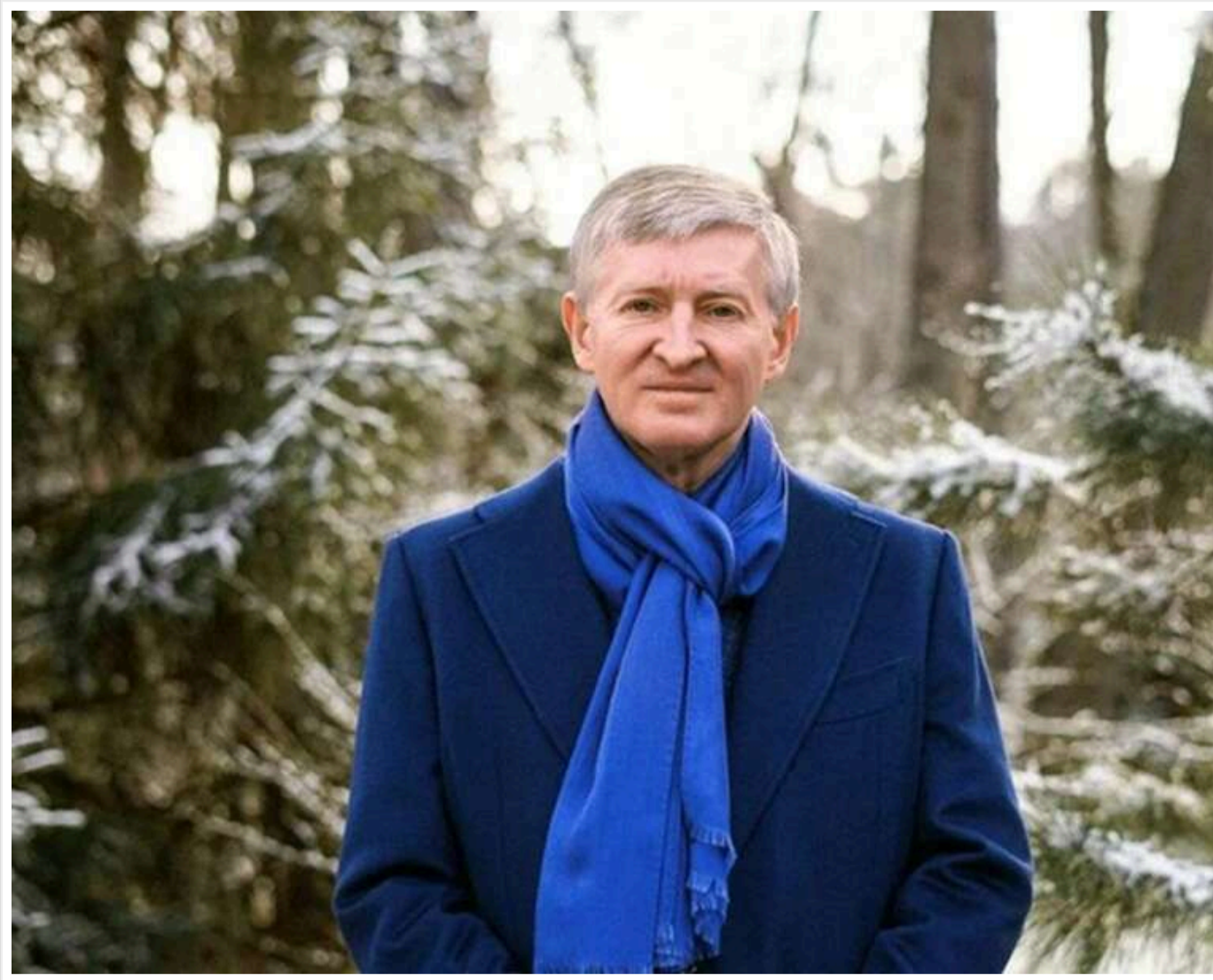
«Зідзвонювалися по кілька разів на день»: Ахметов розповів про розмову з «Редісом» перед виходом з «Азовсталі»

Найбагатший українець Рінат Ахметов розповів, що після повномасштабного вторгнення РФ у 2022 році, під час оборони Маріуполя бійцями полку «Азов», він постійно підтримував зв'язок із командиром захисників бригади, генералом Денисом Прокопенком ("Редісом").