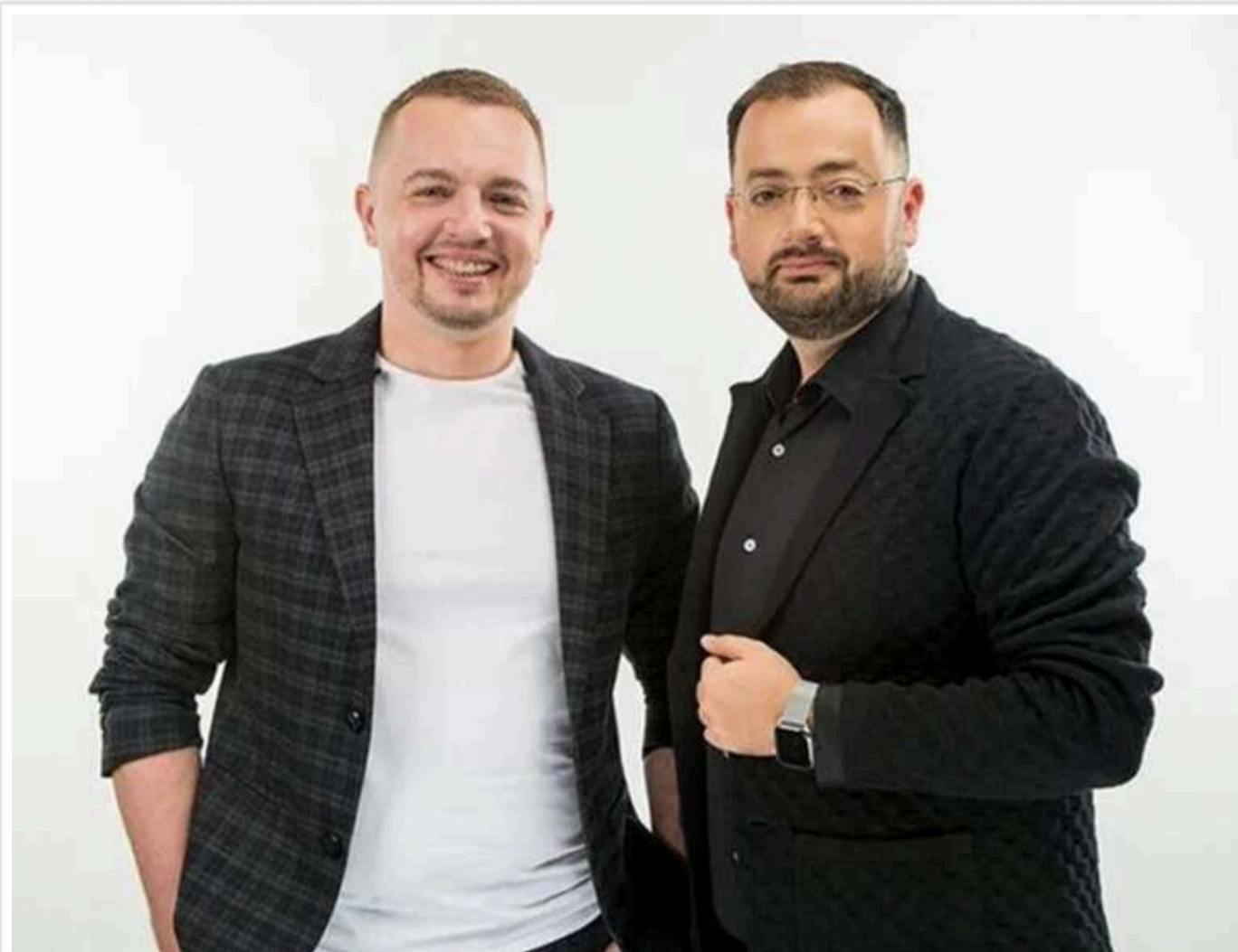
Російські клони та фіктивне волонтерство: як бенефіціари ТЕСНІА Крот та Лазебніков інтегрували гральний бізнес РФ в Україну

Російський слід та фіктивна благодійність: як бенефіціари холдингу ТЕСНІА впровадили ворожий гральний бізнес в Україну.