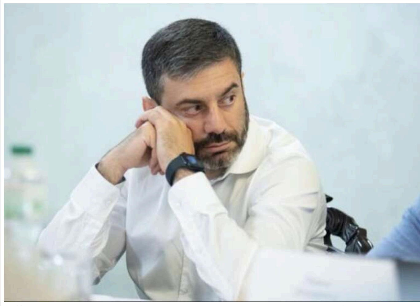
Омбудсмен Дмитро Лубінець розкритикував реформу ТЦК та заявив про системні порушення прав громадян

Читати на руском Read in English Додати як бажане джерело в Google