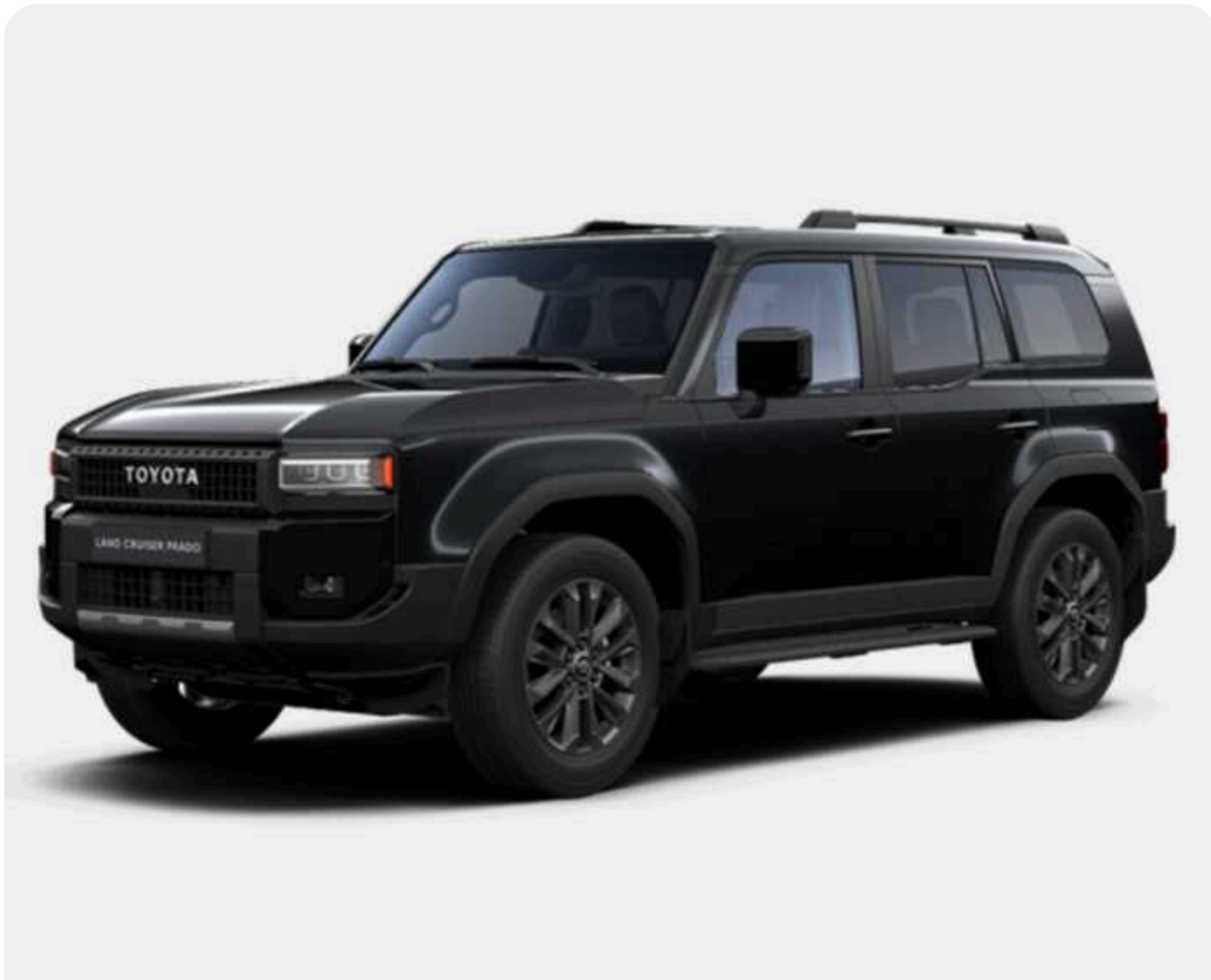
Управління держохорони придбало три спецавтомобілі на базі Toyota Land Cruiser Prado за 9,9 мільйона гривень

Управління державної охорони України 26 травня за результатами тендеру замовило ТОВ «Гранд Мотор» легкових автомобілів на 9,91 млн грн.