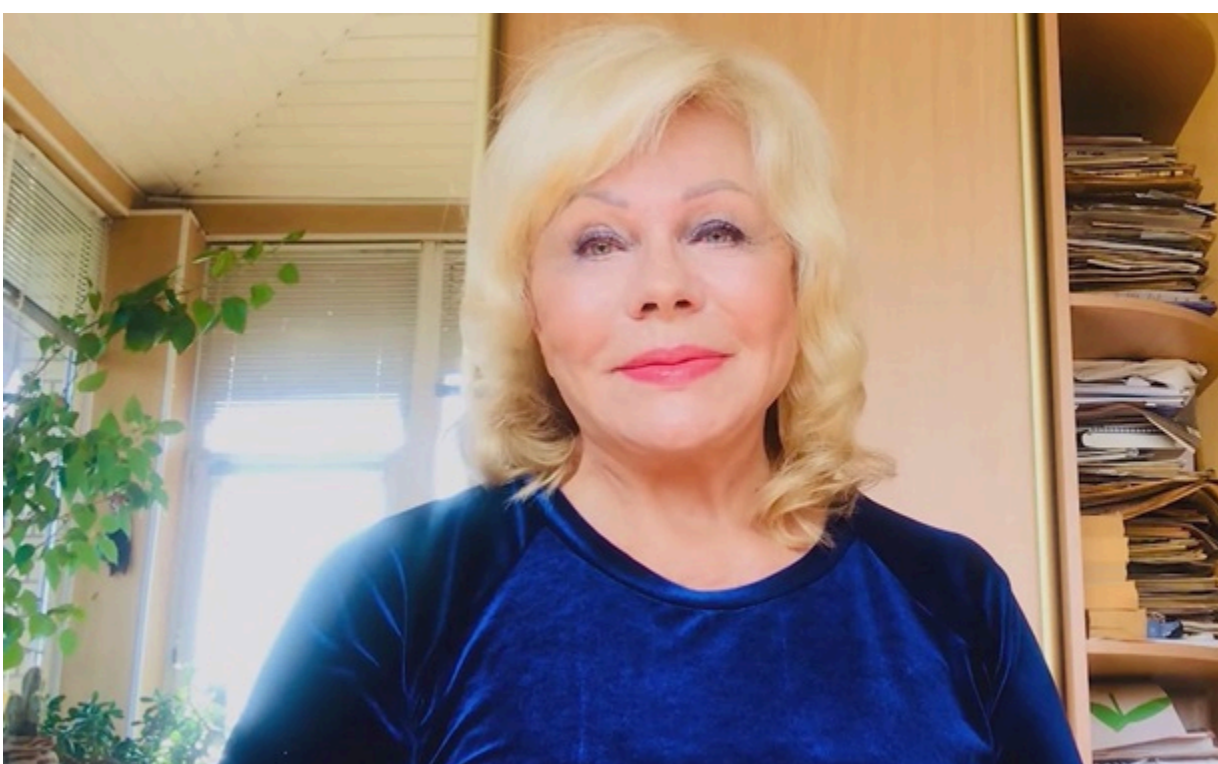
Фото: Instagram.com/svitlana_bilonozhko Світлана Білоножка

Шанувальники в коментарях відзначили вишуканий стиль артисток та їхню прихильність до українських дизайнерів і традиційних мотивів.