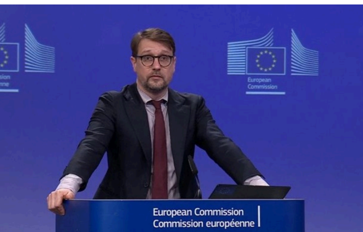
Маркус Ламмертер не надав подробиць

Міністри внутрішніх справ країн Євросоюзу у четвер обговорять варіанти дій щодо українців призовного віку.