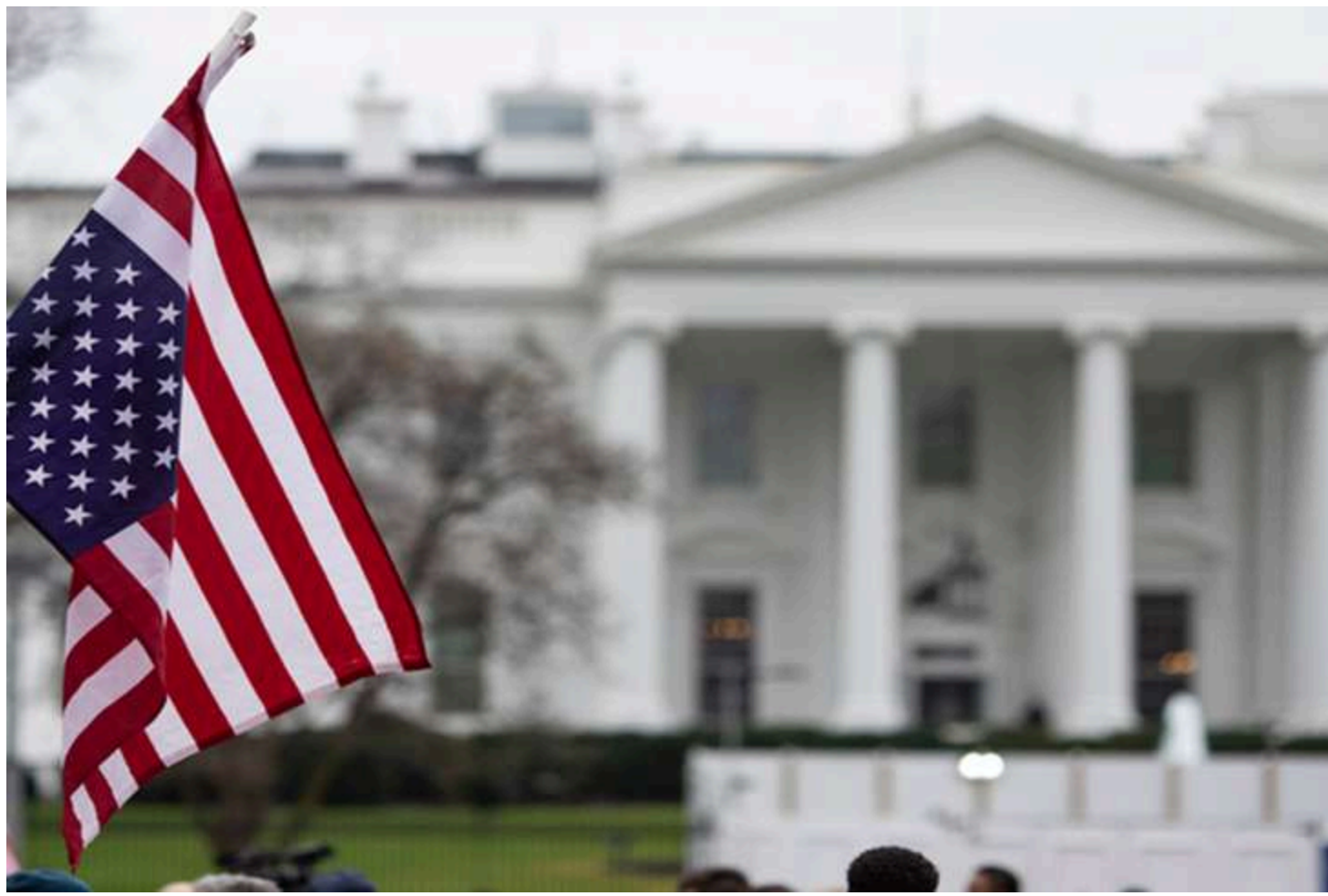
Ілюстративне фото з відкритих джерел

Адміністрація президента США Дональда Трампа скоротила фінансування програм, які допомагали Україні розслідувати воєнні злочини Росії. Йдеться про ініціативи з документування атак на цивільних, тортур, сексуального насильства, депортації дітей та інших злочинів, скоєних після початку повномасштабного вторгнення РФ, пише Reuters.