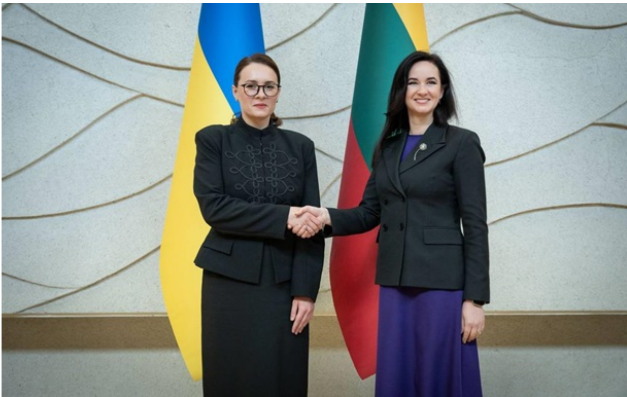
Юлія Свириденко і Інґа Ругінене під час зустрічі 1 червня

Також Юлія Свириденко здійснить візит до Латвії і зустрінеться з новим прем'єр-міністром Андрісом Кулбергсом.