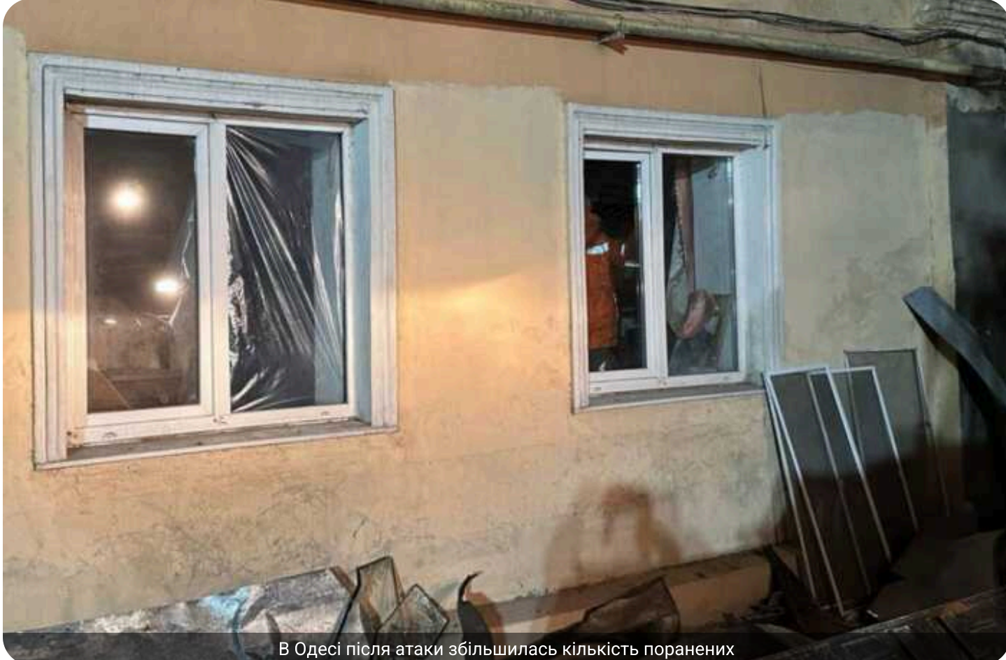
В Одесі після атаки збільшилась кількість поранених

В Одесі кількість постраждалих внаслідок дронавої атаки зросла до п'яти людей. Також пошкоджено інфраструктуру та багатоквартирні будинки.