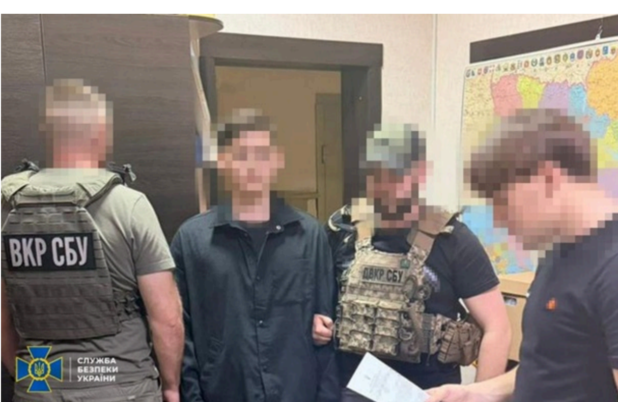
Агенту загрожує до 8 років позбавлення волі

Найбільше ворога цікавили бойові позиції зенітно-ракетних комплексів та радіолокаційних станцій ЗСУ, по яких готували нові обстріли.