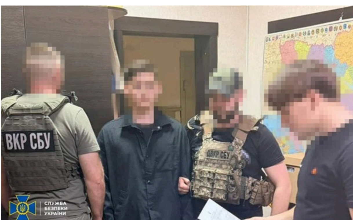
Агенту загрожує до 8 років позбавлення волі

Найбільше ворога цікавили бойові позиції зенітно-ракетних комплексів та радіолокаційних станцій ЗСУ, по яких готували нові обстріли.