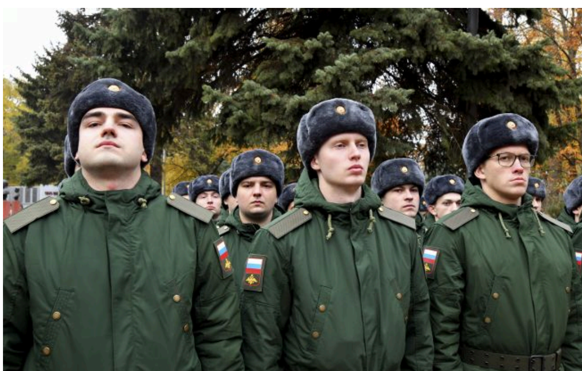
Фото: Що джерела розповіли про плани Путіна