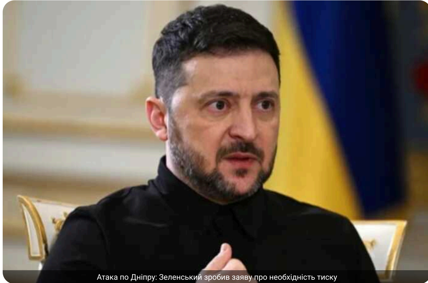
Атака по Дніпру: Зеленський зробив заяву про необхідність тиску

Для забезпечення безпеки та припинення війни потрібне посилення політичного й економічного тиску на Росію, а також стабільна міжнародна підтримка України.