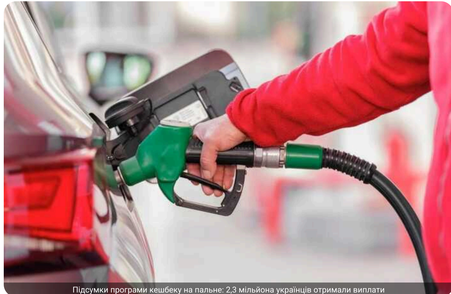
Підсумки програми кешбеку на пальне: 2,3 мільйона українців отримали виплати

Програма кешбеку на пальне в Україні, що тривала з 20 березня до 31 травня, офіційно завершена. Нею скористалися близько 2,3 млн громадян.