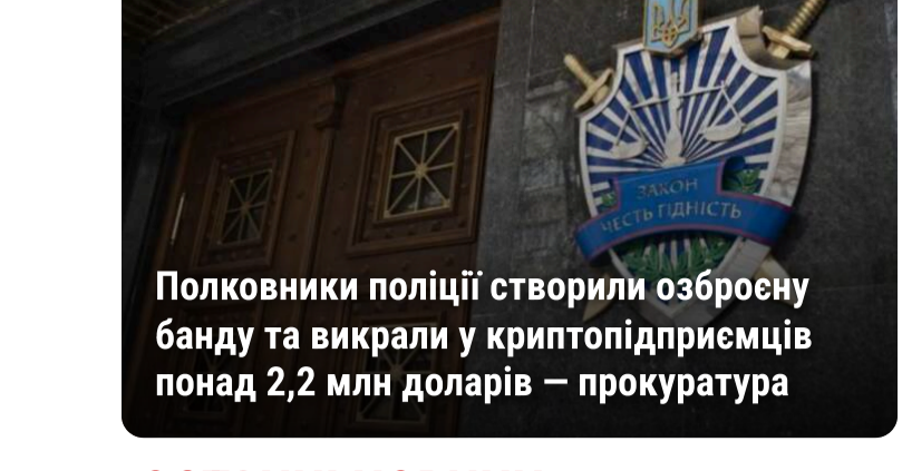
КРИМІНАЛ Полковники поліції створили озброєну бандачу та викрали у криміналістів понад 2,2 млн доларів — прокуратура