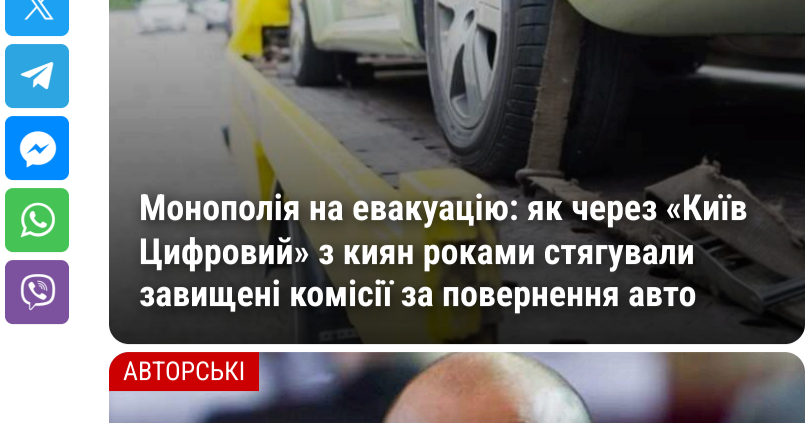
КРИМІНАЛ Монополія на евакуацію: як через «Київ Цифровий» з киян роками стягували завищені комісії за повернення авто

Попри застереження близьких, що Берги/Джукича і Ко обіцянками найскорішого звільнення зразка літа 2020 року банально "розводять на гроші", чорногорсь був левен; "Я вниду, просто спостерігайте. Ти не знаєш, що це за країна: за гроші тут можна зробити, що завгодно. Ми вчотирьох дамо 2 мільйони, щоб мене відпустили, й дали втекти".