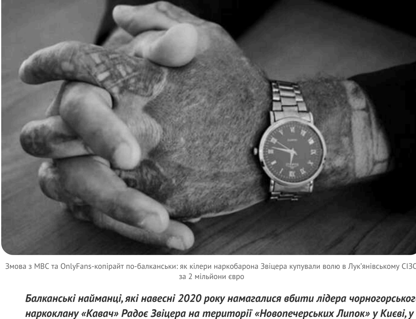
Змова з МВС та OnlyFans-копірайт по-балканськи: як кілери наркобарона Звіцера купували волю в Лук'янівському СІЗО за 2 мільйони євро

Балканські найманці, які навесні 2020 року намагалися вбити лідера чорногорського наркоклану «Ковача» Радоє Звіцера на території «Новоапчерських Липок» у Києві, у ставленій території №2 продовжують обговорювати деталі угоди. За даніми слідства, вони також розробляли два варіанти своєї звільнення з подальшою втечею від правосуддя. Інформація стала відома з фрагментів переписки у зашифрованому месенджері Sky ECC, які були частково оприлюднені Виоким судом Подборщі та передані ЗМІ.