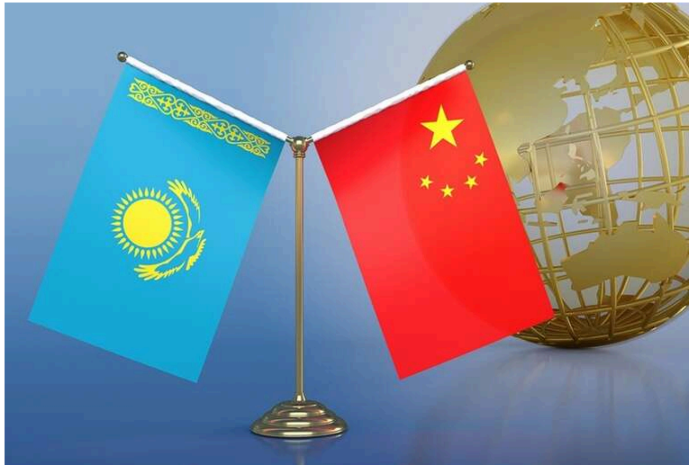
Росія втрачає статус транзитного вузла: Китай та Казахстан вкладають мільярди в альтернативний шлях до ЄС

Китай у найближчій перспективі планує суттєво збільшити обсяги вантажних перевезень до Європи через Транскаспійський міжнародний транспортний маршрут (ТМТМ), відомий як «Серединний коридор», який проходить в обхід території Росії.