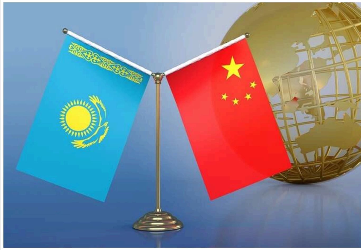
Росія втрачає статус транзитного вузла: Китай та Казахстан вкладають мільярди в альтернативний шлях до ЄС

Китай у найближчій перспективі планує суттєво збільшити обсяги вантажних перевезень до Європи через Транскаспійський міжнародний транспортний маршрут (ТМТМ), відомий як «Серединний коридор», який проходить в обхід території Росії.