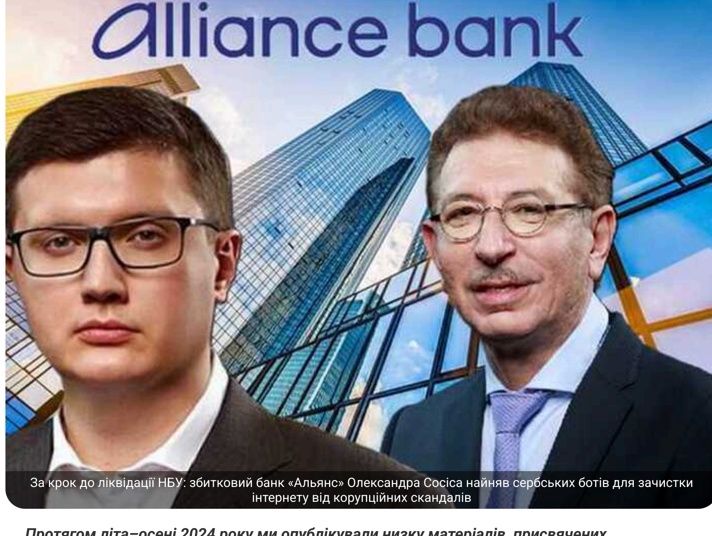
За крок до ліквідації НБУ: збитковий банк «Альянс» Олександра Сосіса найняв сербських ботів для зачистки інтернету від корупційних скандалів

Протягом літа–осені 2024 року ми опублікували низку матеріалів, присвячених діяльності банку «Альянс». Більшість із них базувалися на даних з відкритих джерел, а один із матеріалів – на коментарі політолога Володимира Горковенка.