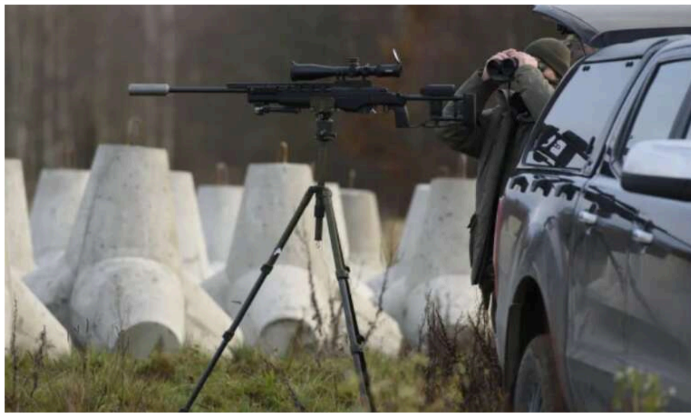
Збройні сили РФ здатні без зусиль прорвати укріплення під Дніпром, — FT

Рівень будівництва оборонних ліній у Дніпропетровській області, як зазначається в матеріалі, загрожує проривом фронту. Зараз правоохоронні органи розслідують десятки можливих випадків розкрадання коштів під час спорудження фортифікацій.