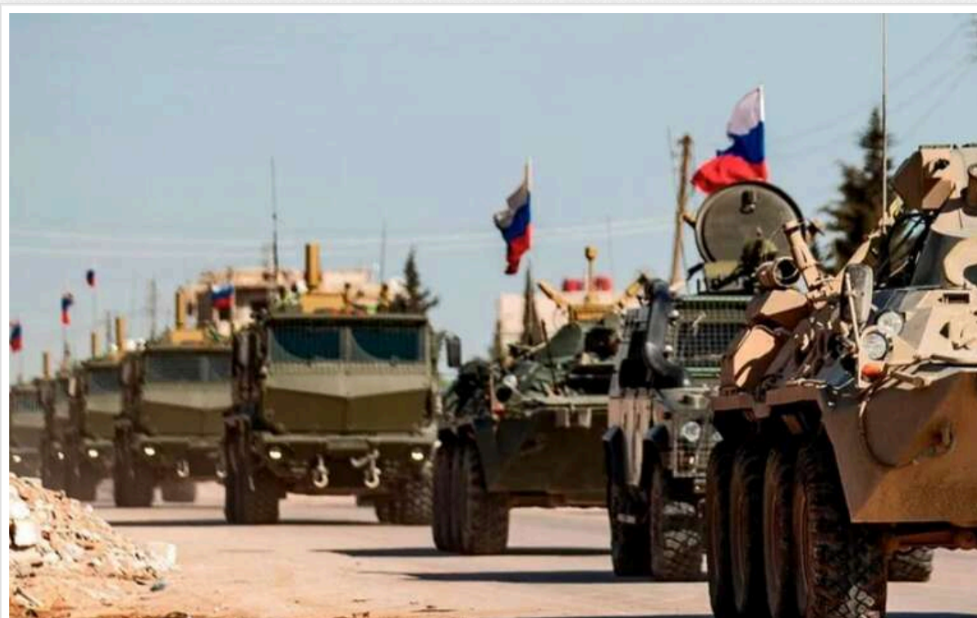
Центр протидії дезінформації оцінив, скільки російських військових може бути перекинута з Сирії в Україну

Після падіння режиму диктатора Башара Асада країна-агресорка Росія має можливість перекинути своїх військових із Сирії в Україну. Однак йдеться про відносно невелику кількість окупантів.