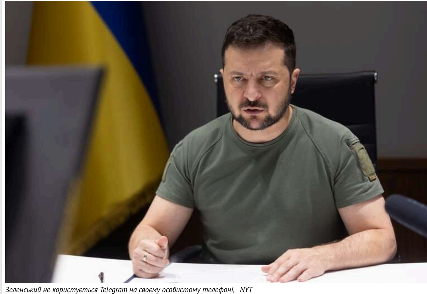
Зеленський не користується Telegram на своєму особистому телефоні, - NYT

Зеленський не використовує Telegram на своєму особистому телефоні "з міркувань безпеки", хоча в офіційному публіку президента регулярно публікуються пости, повідомляє The New York Times, посилаючись на джерела.