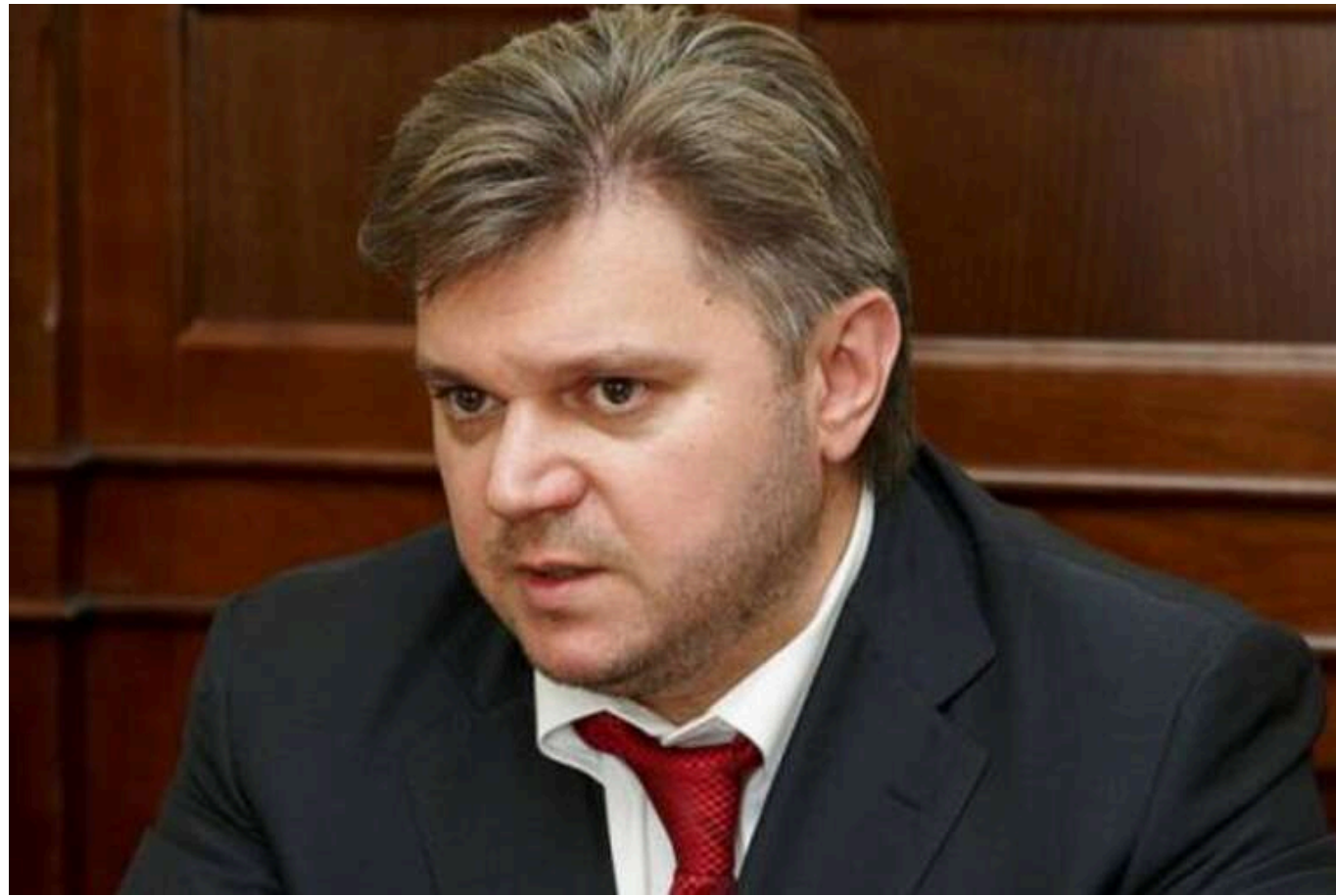
Майно сім'ї колишнього міністра Ставицького знову під арештом

У 2012-2013 роках Едуард Ставицький надав ТОВ «Голден Деррік» без проведення конкурсу 19 спеціальних дозволів на використання надр.