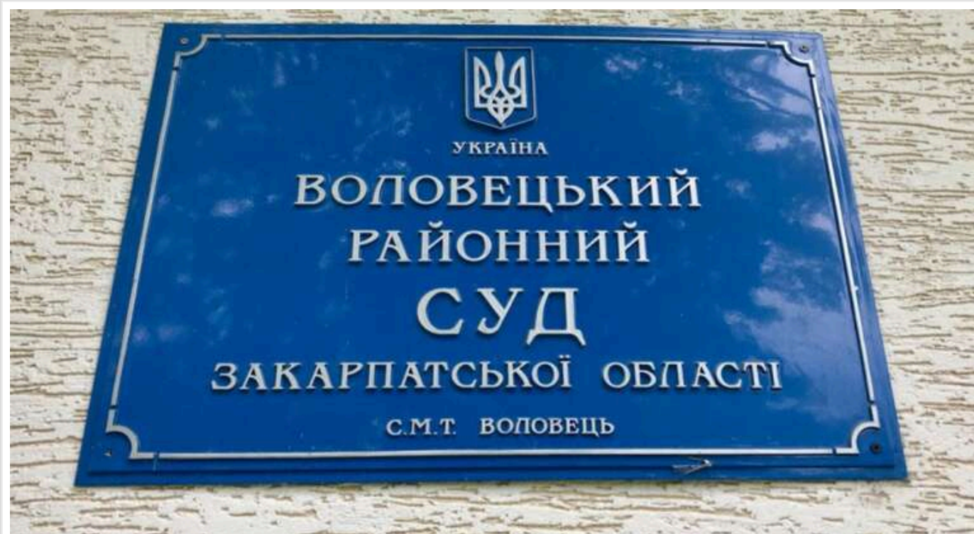
Судовий розгляд у справі групового зґвалтування 14-річної учениці на Закарпатті завис

5 грудня мало відбутися чергове засідання Воловецького районного суду Закарпатської області у справі у зґвині справі про зґвалтування. Три роки тому учні зі школи села Верхні Ворота (15-річні двоє братів-близнюків і їхній однокласник) вчинили сексуальне насилля стосовно 14-річної подруги.