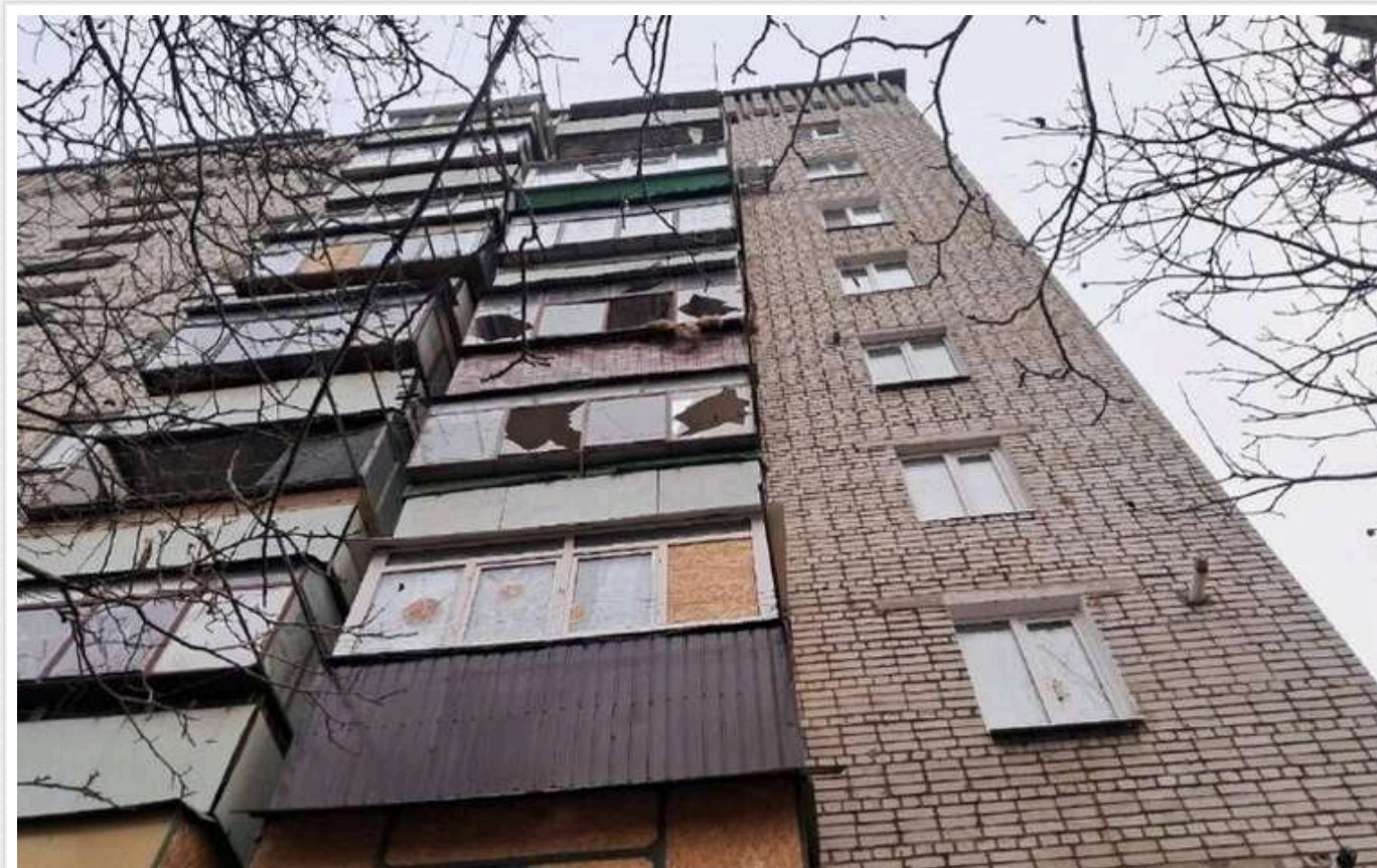
Упродовж дня ЗС РФ завдавали ударів по Дніпропетровщині: пошкоджені будинки, газогін, заправка

Протягом неділі, 8 грудня, російські окупанти обстріляли із дронів та артилерії два райони Дніпропетровщини. Є пошкодження інфраструктури.