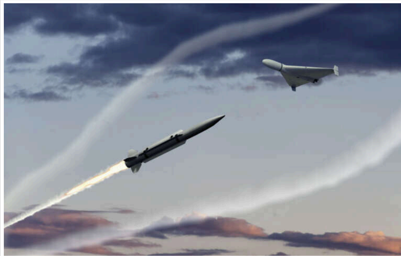
У РФ готують ресурси для нових атак на Україну

Російська Федерація продовжує підготовку ресурсів для нових атак на Україну. Окупанти не змінюють свою стратегію.