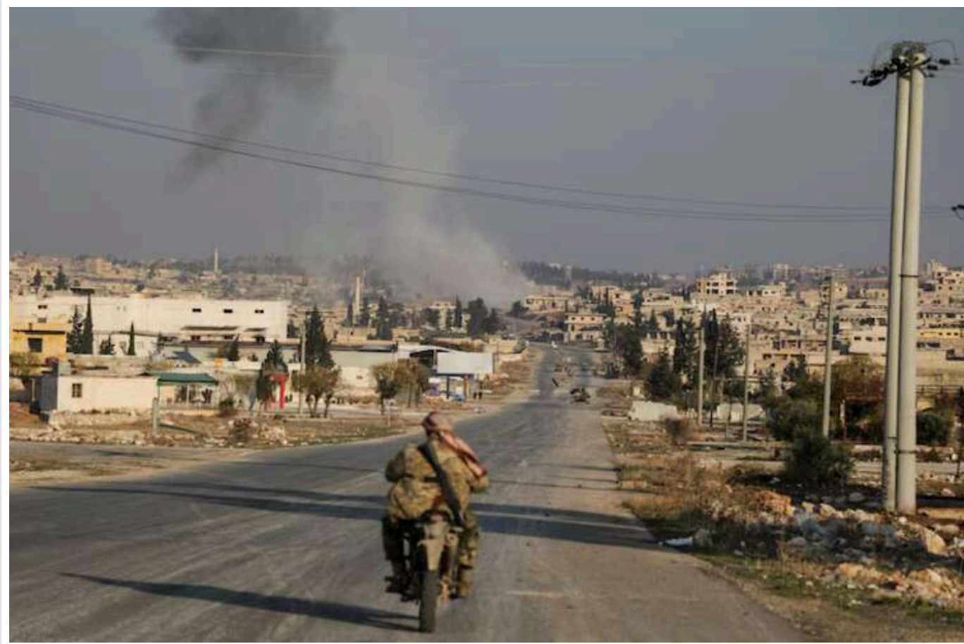
У ЦПД проаналізували, який вплив події в Сирії матимуть на Україну

Країна-терористка Росія втратила ключову зону впливу на Близькому Сході разом із логістичними базами. Проте події в Сирії жодним чином не вплинуть на здатність РФ у веденні війни проти України.