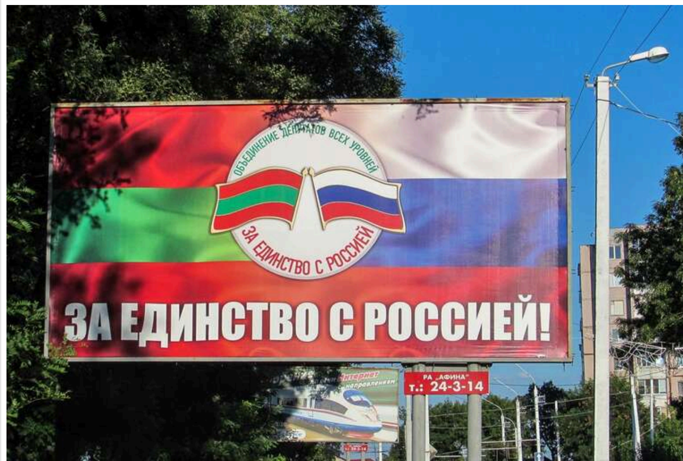
Військовий оцінив можливість нападу Росії на Одещину з території Придністров'я

Російські сили, ймовірно, не наважаться на наступ із Придністров'я в напрямку Одещини. Якби у них була така можливість, вони б спробували це ще навесні 2022 року.