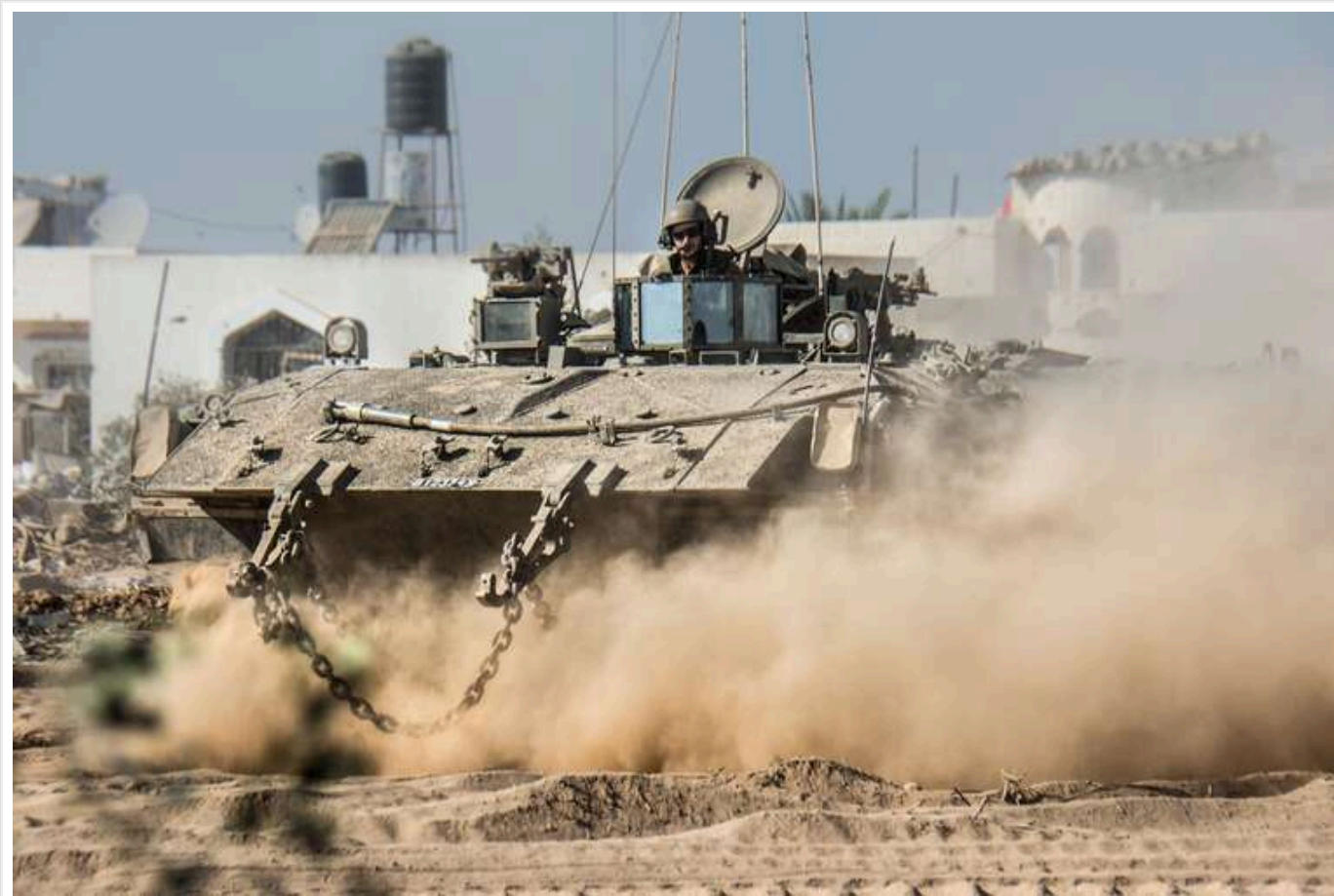
У ЦАХАЛ пояснили, чому ввели війська у "буферну зону" на території Сирії

ЦАХАЛ розгорнув підрозділи в буферній зоні та інших стратегічно важливих місцях, щоб забезпечити безпеку жителів Голанських висот і громадян Ізраїлю. Такі дії стали відповіддю на ситуацію в Сирії, зокрема розміщення озброєного персоналу в буферній зоні.