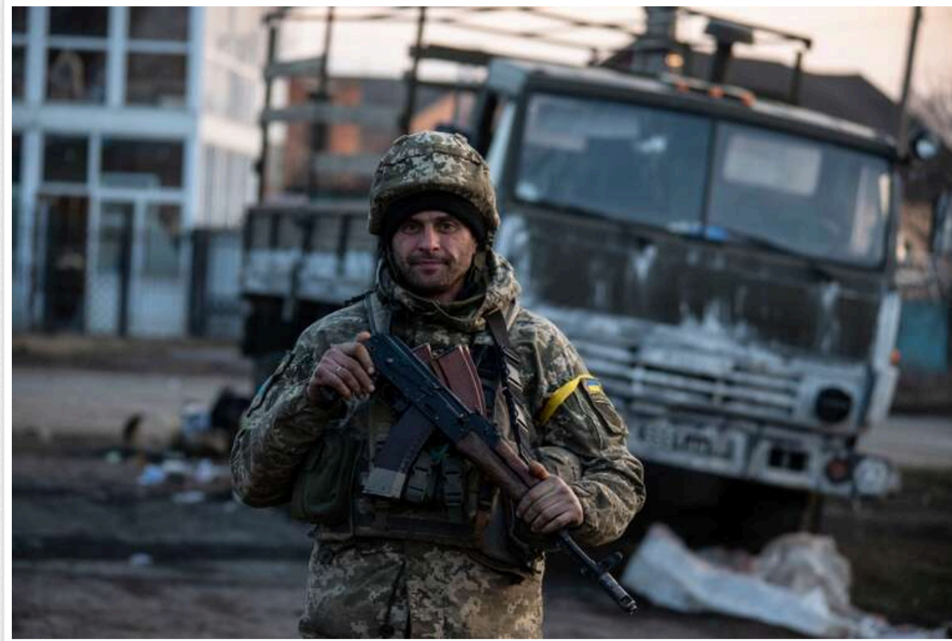
Ситуація на фронті: ЗСУ завдали ударів по пунктах управління та важливому об'єкту ворога

Сили оборони завдали ударів по командних пунктах ворога. За добу в боях загинуло 1460 окупантів.