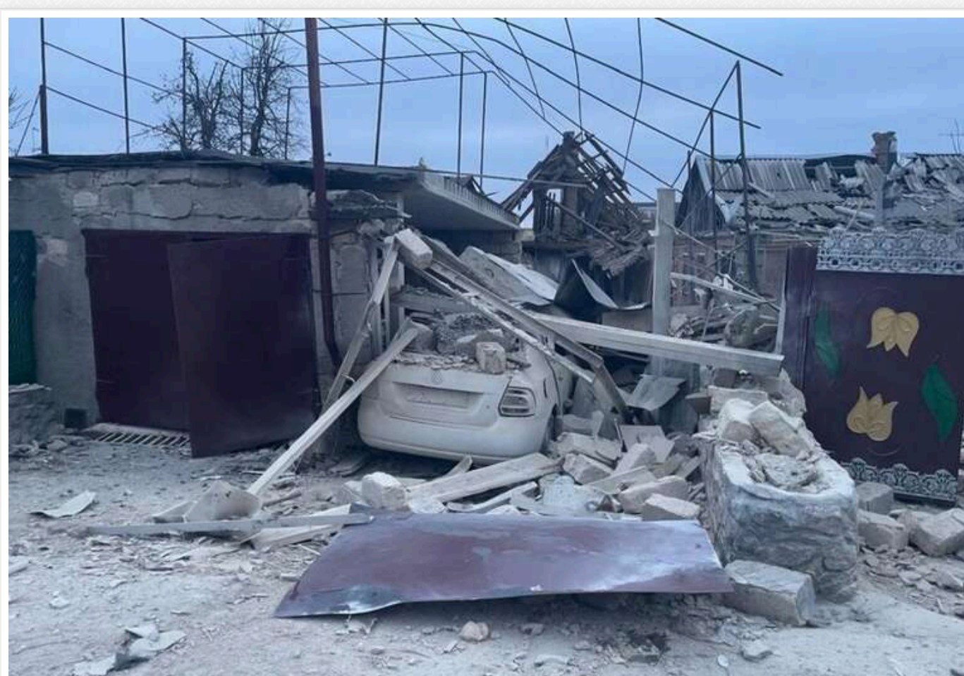
ЗС РФ атакували Нікопольщину: пошкоджено 5 будинків, авто й інфраструктура

Протягом 7 грудня російські війська здійснили атаки на Нікопольський район Дніпропетровської області за допомогою дронів-камікадзе, важкої артилерії та "Градів".