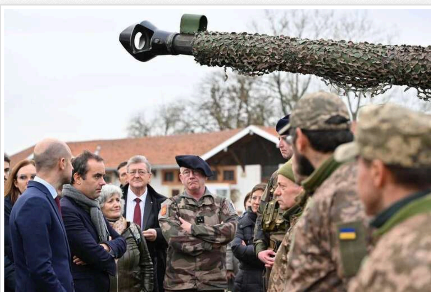
Нардепка Безугла звинуватила керівництво у розділенні 155-ї бригади ЗСУ

Нардепка Мар'яна Безугла повідомляє, що 155-ту бригаду ЗСУ імені Анни Київської, яку навчили і озброїли у Франції, по прибуттю в Україну розділили поміж іншими бригадами та відправили на фронт без бойового злагодження.