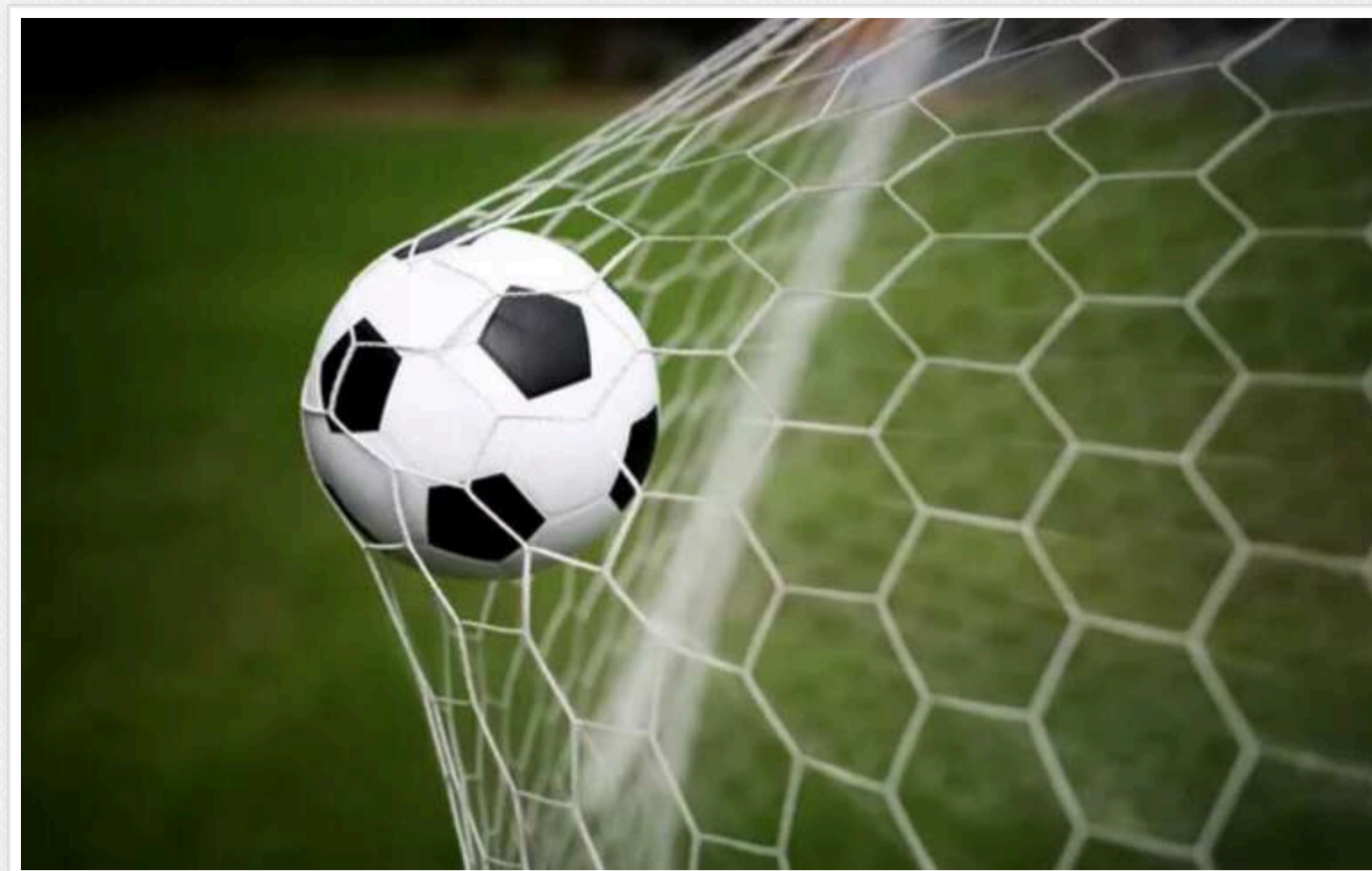
У футболі запроваджують нове правило

Міжнародна рада футбольних асоціацій, яка регулює та визначає зміни футбольних правил (IFAB), розглядає запровадження нового правила, спрямованого на боротьбу із затягуванням часу воротарями, повідомляє The Daily Mail.