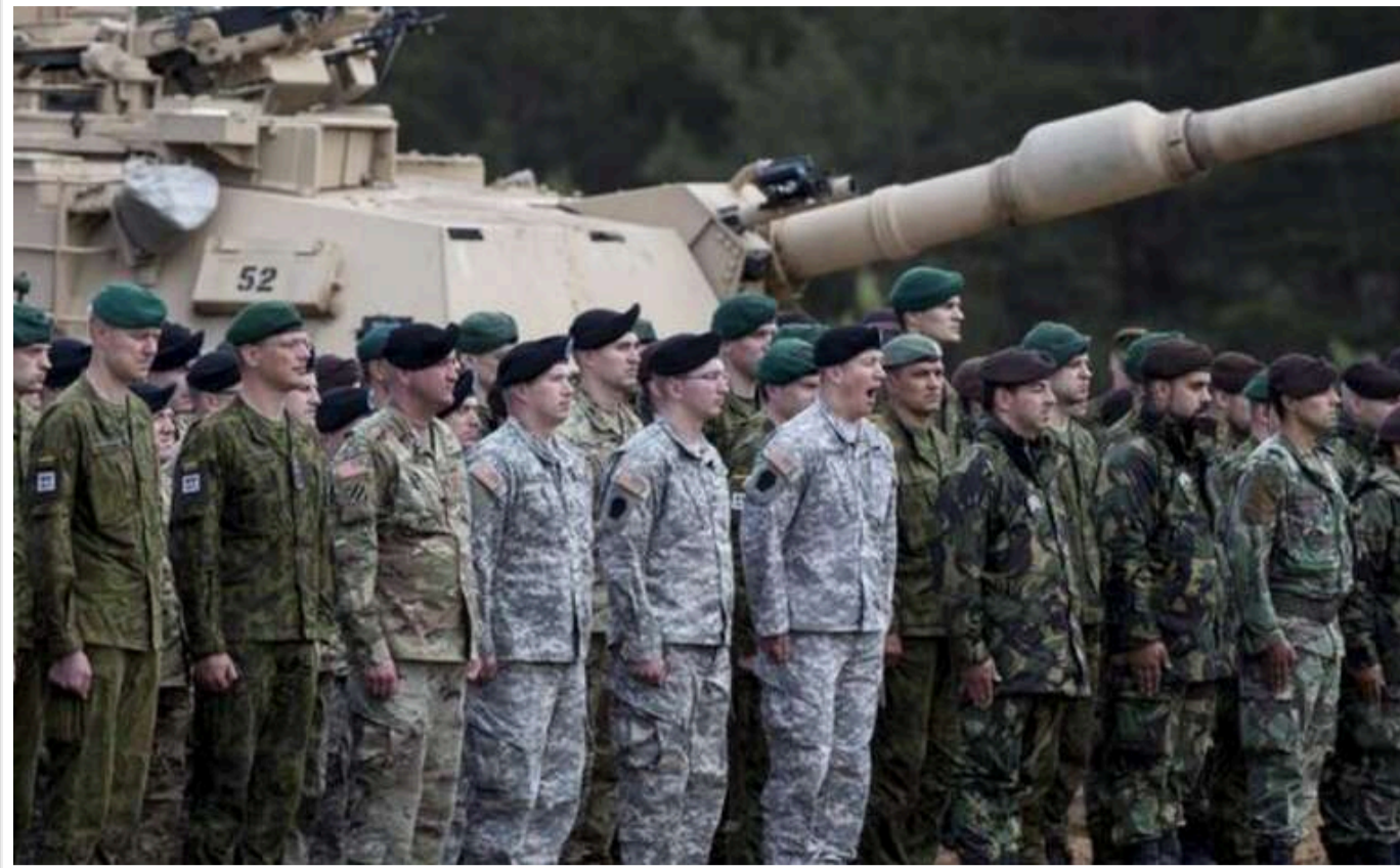
На території європейських країн НАТО перебувають приблизно 80 тисяч американських військових, – Байден

На території європейських країн НАТО розміщено близько 80 тисяч американських військових. Присутність американського контингенту спрямована на підтримку союзників та стримування подальшої російської агресії.